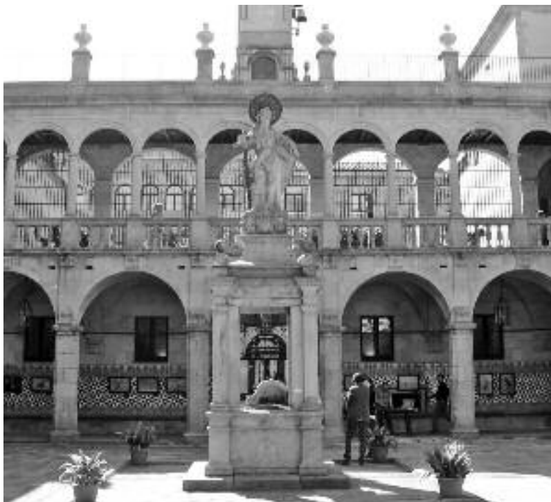
Pati de la Casa de Convalescència, seu de l'Institut d'Estudis Catalans.