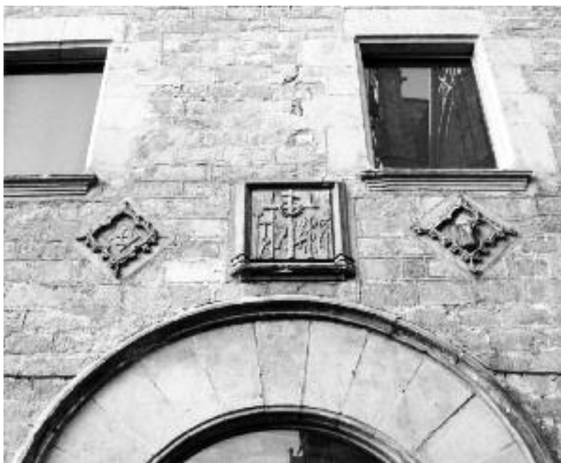
La Pia Almonia.

Prop de les Drassanes s'alçava l'Hospital de Sant Nicolau (7), un casalot de pelegrins que, segons la tradició, va acollir sant Francesc d'Assís quan feia el camí de Sant Jaume, l'any 1214. Aquest fet va propiciar que en aquell indret s'hi construís més endavant un convent de franciscans, conegut per Framenors, enderrocat el 1837 poc després de la desamortització de Mendizábal.