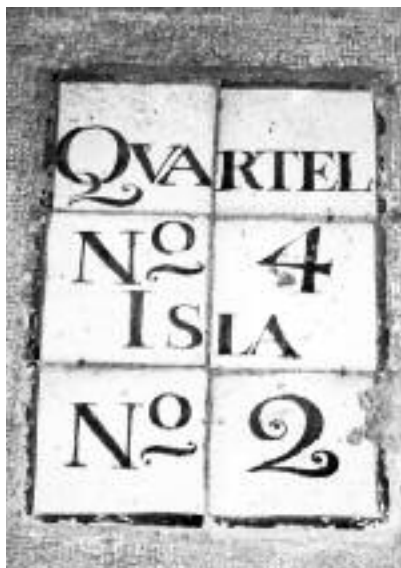
Placa de quarter del segle XVIII, encara existent al carrer del Call de Barcelona.

Per evitar el tràfec, els carters es van empescar diverses tàctiques, una de les quals era anunciar la seva presència amb dos cops del picaporta, de manera que el veïnat sabia que qui trucava era el carter. Després feia un, dos o tres repicons per indicar el pis on anava dirigida la carta, de manera que l'interessat baixava al portal per rebre-la.