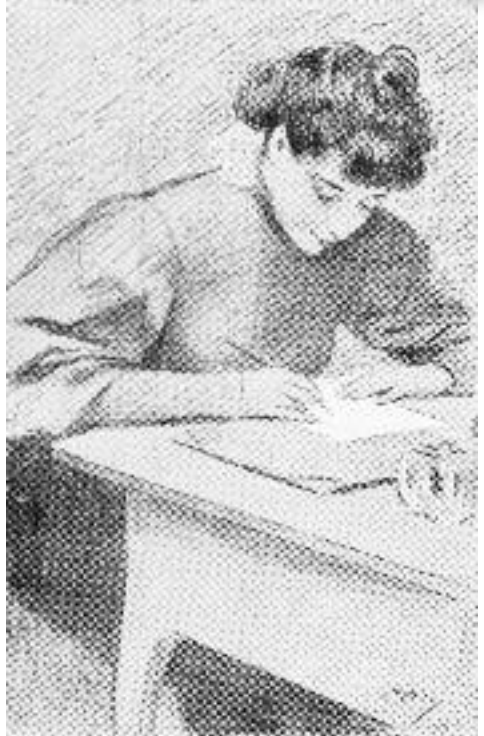
Postal d'Antoni Utrillo.

Barcelona va anar incrementant les seves seccions de repartiment, a mesura que la ciutat creixia. El 1814, per exemple, la ciutat estava dividida en vuit barris, cadascun amb el seu carter, com recollia el Diari de Barcelona , en la seva edició del 23 de juliol: