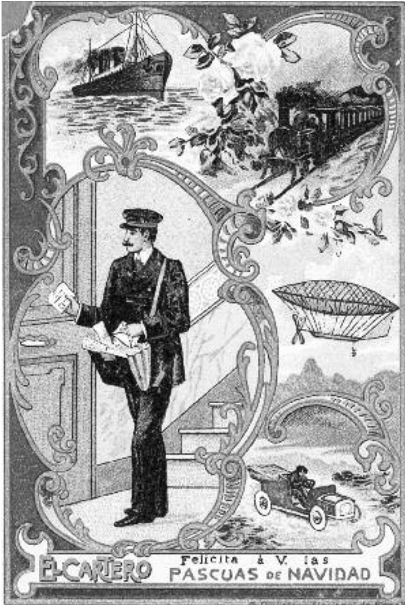
Nadala de carter.

tenien característiques diferents en funció de la població, de manera que s'unificà, prenent com a model el dels carters de Madrid. El Reglament de Carters de Barcelona de 1903 ho recollia d'aquesta manera: