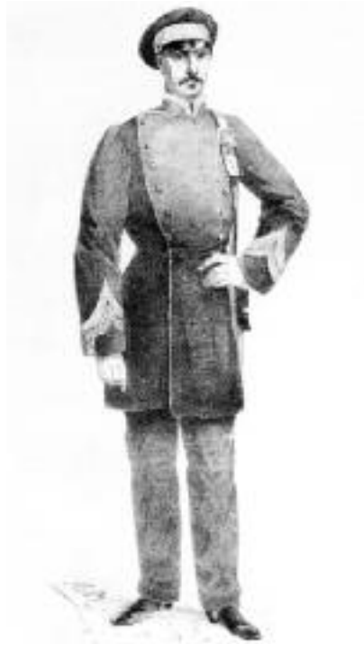
Imatge d'un carter amb el seu uniforme, inclòs a l'Orden de la Dirección General del 19 de desembre de 1856.