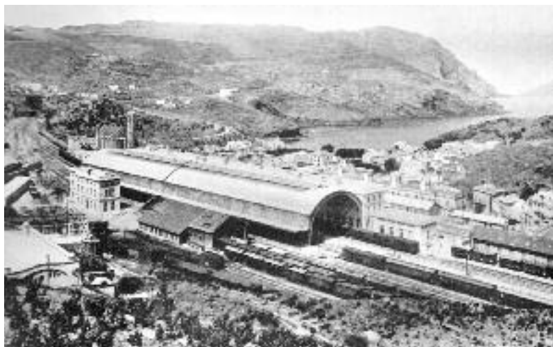
Vista de Portbou el 1936, en una postal d'MZA.