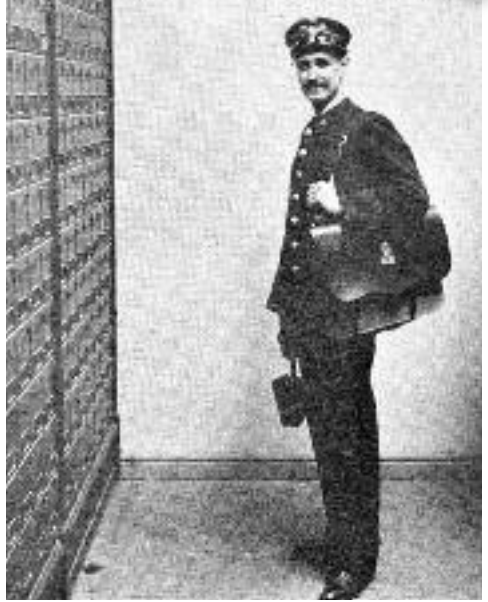
Uniforme de carter dels anys cinquanta.

La americana será de color gris, con dos filas de tres botones planos dorados con el emblema de Correos; dos bolsillos, uno a cada costado, con cartera y el distintivo en el cuello, consistente en la carta plateada con dos alas doradas y corona mural también dorada. El pantalón y la gorra serán, asimismo, de lana gris con distintivo esta última análogo al de la americana. La pelliza será también gris, impermeabilizada, de factura semejante a la americana, y con forro de lana. Este uniforme se usará en todo tiempo, debiendo durar dos años. A la duración de la pelliza se le asignan tres temporadas. El uso del uniforme debe reducirse a los actos de servicio.