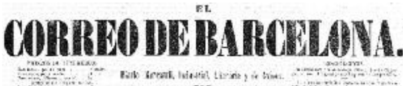
Capçalera del diari 'El Correo de Barcelona', corresponent a 1852.

Quan el destinatari d'una carta la recollia, la llegia allà mateix, a la plaça, i sovint comentava els fets que considerava que no formaven part de la seva intimitat, és a dir, que es difonien les notícies de fets que passaven en llocs llunyans. Fins i tot existien les denominades cartes obertes o públiques, similars a les cartes que els lectors trameten als diaris, que estaven escrites per ser llegides públicament. Fruit d'aquesta relació entre informació i correu és el fet que moltes capçaleres de periòdics incorporeessin la paraula correu: El Correo Catalán , El Correo de Barcelona , Correo de Gerona , The Washington Post , El Corriere della Sera , etc.