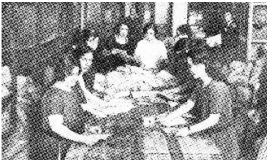
Un grup de dones en plena feina de classificació, durant la vaga de 1922.