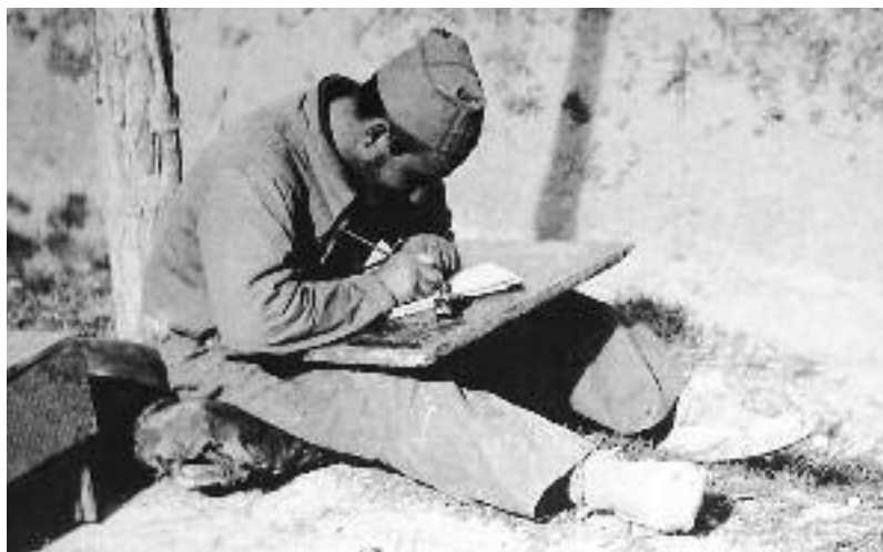
Un soldat aprofita un descans per escriure una carta al front d'Aragó, l'agost de 1936, en una fotografia de J. M. Pérez Molinos.

correu en un furgó fins a les proximitats de la línia de foc. A les trinxeres hi havia diversos punts establerts per al repartiment de cartes, entorn dels quals els soldats esperaven notícies ansiosament. Rosario va fer de cartera de campanya fins al final de la batalla de Brunete, el juliol de 1937.