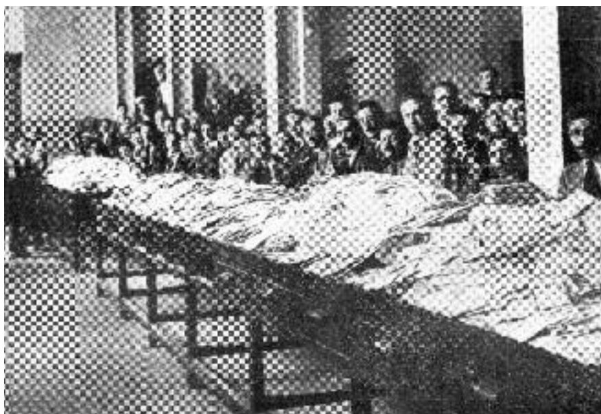
Acumulació de cartes durant la vaga de 1922.