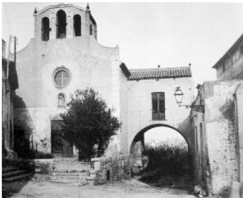
L'església de Santa Eulàlia de Vilapicina, a Barcelona, abans de la gran urbanització del barri.