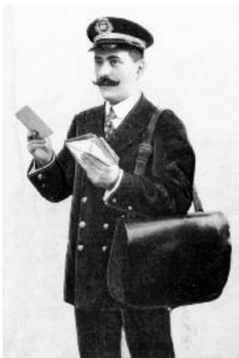
La tradicional imatge d'un carter en una felicitació de Correus.

Si la presència del carter era molt important durant tot l'any, encara ho era més durant les festes de Nadal, quan no solament s'havien de fer càrrec de les cartes adreçades als Reis Mags, sinó també d'un nombre creixent de felicitacions, segons el costum d'enviar christmas implantat per sir Henry Cole, el primer a comercialitzar targetes nadal·lenques, el 1843.