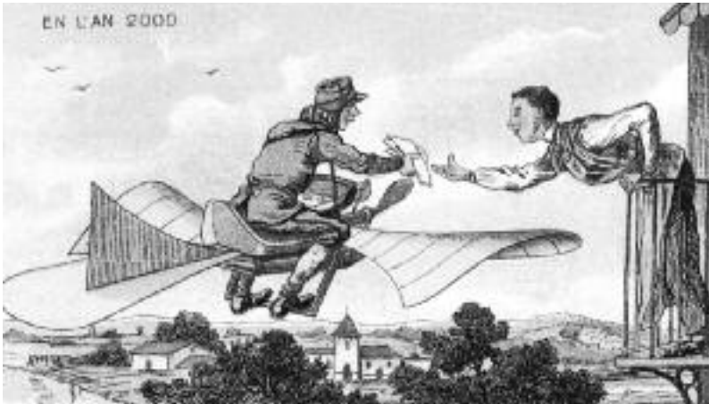
"El carter a l'any 2000", il·lustració de Jean Marc Côté per a la seva obra "Invenció del futur", publicada el 1899.

cartes i petits paquets. De moment, es tracta d'un projecte de la Universitat de Stanford i Swiss Post, tal com recollien diversos mitjans a finals d'agost de 2016, però potser aviat es convertiran en una realitat quotidiana.