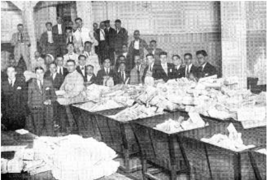
Acumulació de correu durant la vaga de 1922, publicada a 'Mundo Gráfico' el 16 d'agost de 1922.

Darrere de l'església de Santa Eulàlia de Vilapicina, molt a prop de l'actual carrer d'Alloza, hi havia Can Solà, una masia