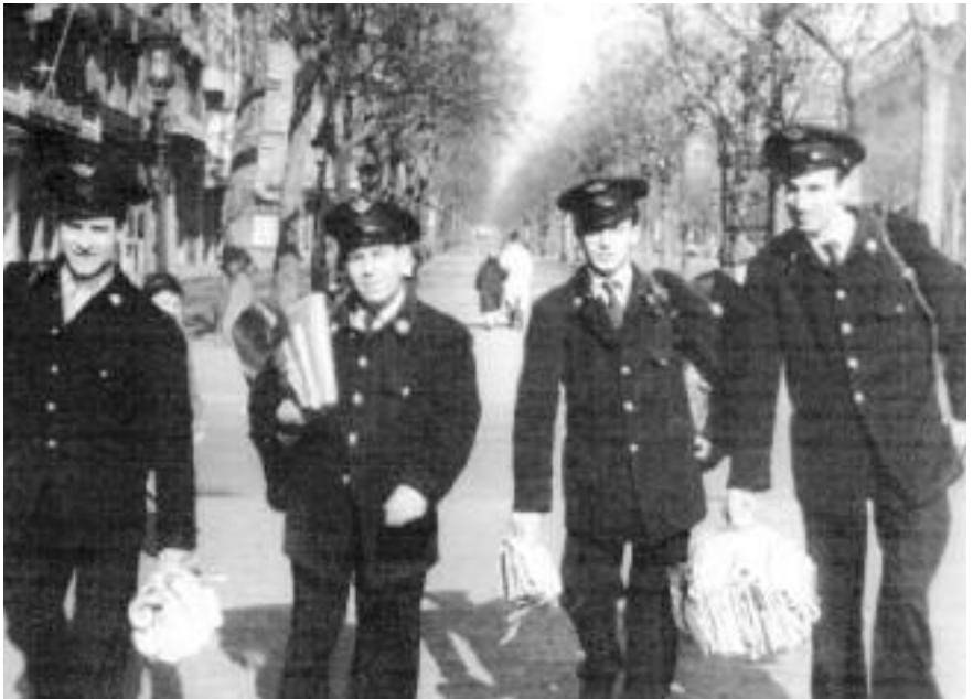
Carters barcelonins dels anys setanta.

El 17 de març de 1977, el director general de Correus li va fer arribar un escrit en què li comunicava que: