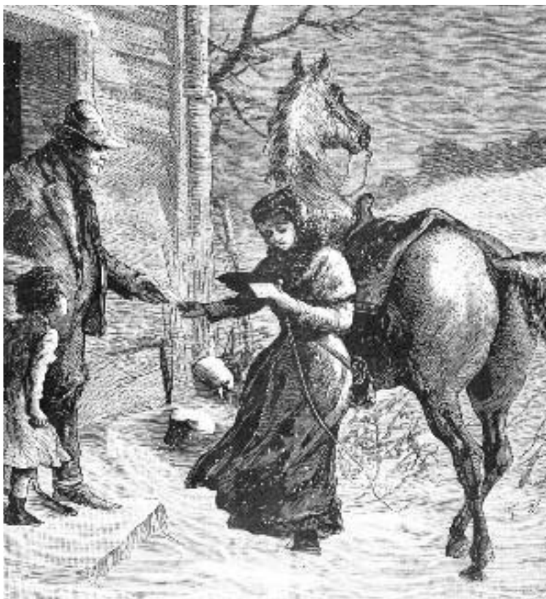
Servei de correus als Estats Units, segons una escena publicada l'any 1892 a "La Ilustración Nacional".

La cartera de Portugaleta havia de portar les cartes des de l'estafeta de Bilbao a Portugaleta i viceversa dos dies a la setmana, els dimecres i els diumenges. El que resulta encara més