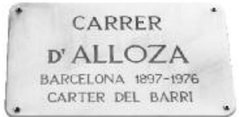
Placa del carrer d'Alloza, carter del barri de Porta.

La realitat, però, era ben bé una altra, ja que el carrer està dedicat a la memòria de