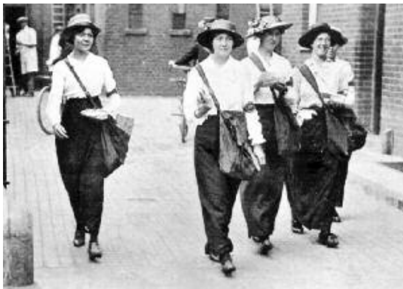
Carteres alemanyes durant la Primera Guerra Mundial, en una fotografia publicada a "La Guerra Ilustrada", número 88.

En alguns països d'Europa, com a França o Alemanya, la incorporació de la dona en el repartiment del correu va estar motivat per situacions bèl·liques. El 1914, per pal·liar la mobilització masculina a causa de l'esclat de la Primera Guerra Mundial, s'hi va incorporar una quantitat molt important de dones, amb una actitud i uns resultats que reberen grans elogis per part de la premsa, ja que les dones expiden las cartas, las distribuyen, y tal prisa y maña se dan en realizar su trabajo que en muchas ciudades jamás se tuvo tan buen servicio de correos como ahora , com afirmava La Guerra Ilustrada .