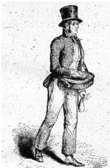
Uniforme de carter de la primera meitat del segle XIX, inclòs a "Los españoles pintados por sí mismos".

Amb l'adopció de l'uniforme també es pretenia igualar les diverses carteries, que