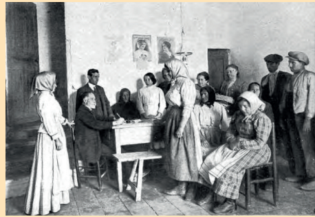
Catalunya en negre