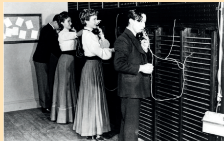
Barcelona, ciència i coneixement