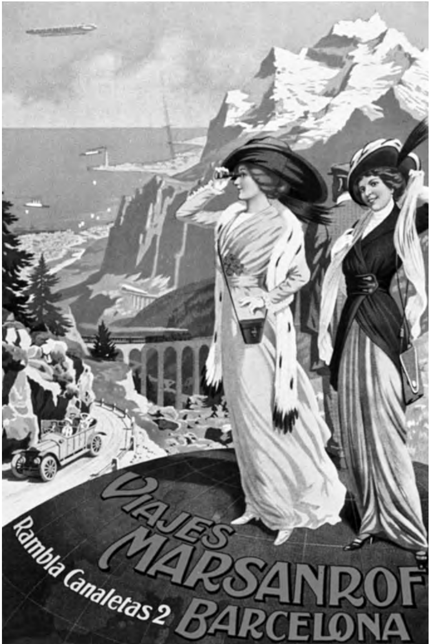
Cartell publicitari de Viajes Marsanrof, amb seu a la rambla de Canaletes, número 2.