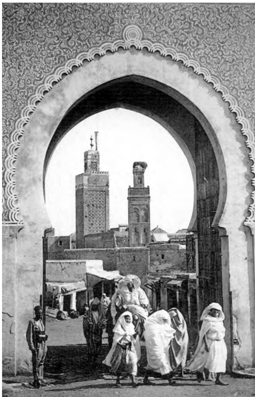
La ciutat marroquina de Marràqueix, cap al 1920.