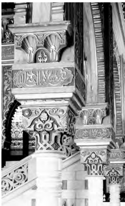
Filera d'arcs i columnes neoàrabs del vestibul.