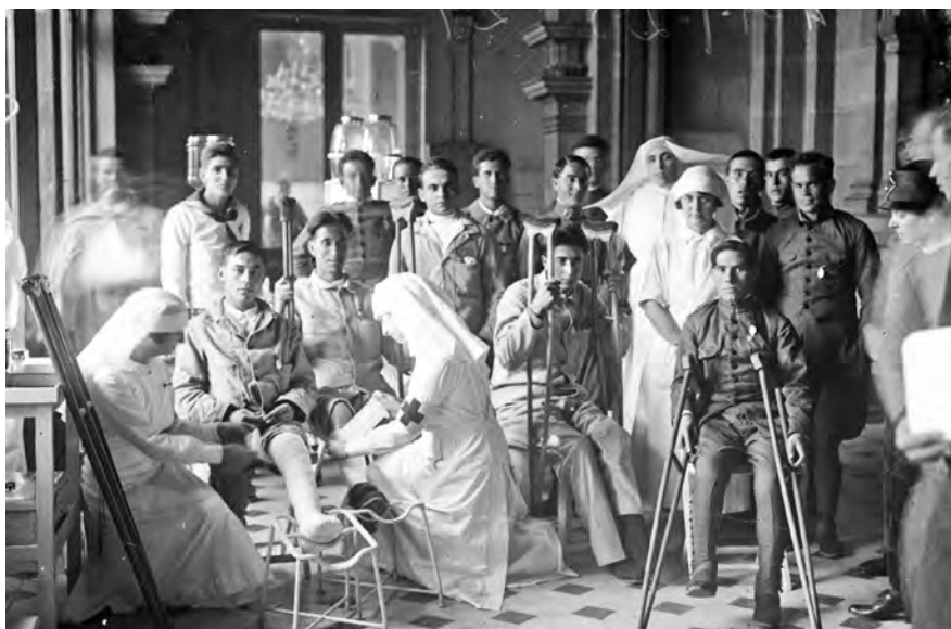
Militars ferits a la Guerra d'Àfrica, en el Gran Casino de Sant Sebastià habilitat com a hospital de la Creu Roja.

Cal tenir en compte que l'intent de reproduir el pati dels Lleons del palau nassarita no era aliè a la influència que va tenir el naixement del turisme i la responsabilitat del promotor