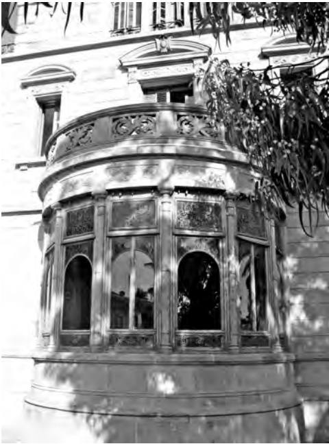
Tribuna de la façana sud.

El resplendent conjunt està perpètuament immers en la llum que s'escola a través de la claraboia i els d'arcs de ferradura polilobulats del tambor que la sustenta.