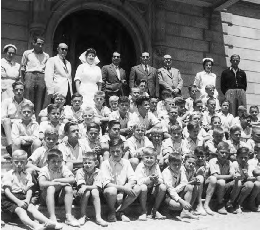
Visita a la nova residència dels nens refugiats polonesos a la Casa Marsans el 9 de juliol del 1946. A la fotografia apareixen el Sr. Marsans i el governador civil.

A partir de 1947, els nens començaren a ser repatriats. La Creu Roja localitzà familiars que no trigaren a reclamar-los i el centre s'escarrassa per vèncer les traves diplomàtiques, sovint contra la voluntat del mateixos nens, que es resistien a abandonar la casa d'acollida. El problema radicava en la impossibilitat de lliurar els nens directament a la Polònia comunista, ja que la institució depenia del Govern a l'exili. Per això, la repatriació fou organitzada per mitjà de l'American Polish War Relief (APWR), un cop acabat el curs escolar i després de la vacances d'estiu, que passaren a la platja de Sant Feliu de Guíxols.