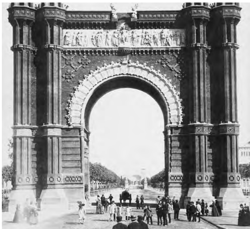
L'Arc de Triomf, al passeig de Sant Joan, en una fotografia de M. Lévy i J. León. (Cornell University Library).