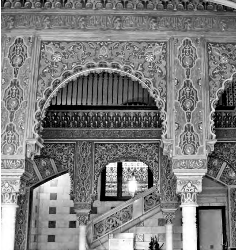
Vista del pati interior d'estil neoàrab, detall dels arcs lobulats policroms.

francès, per minimitzar els possibles abusos en el canvi de divises.