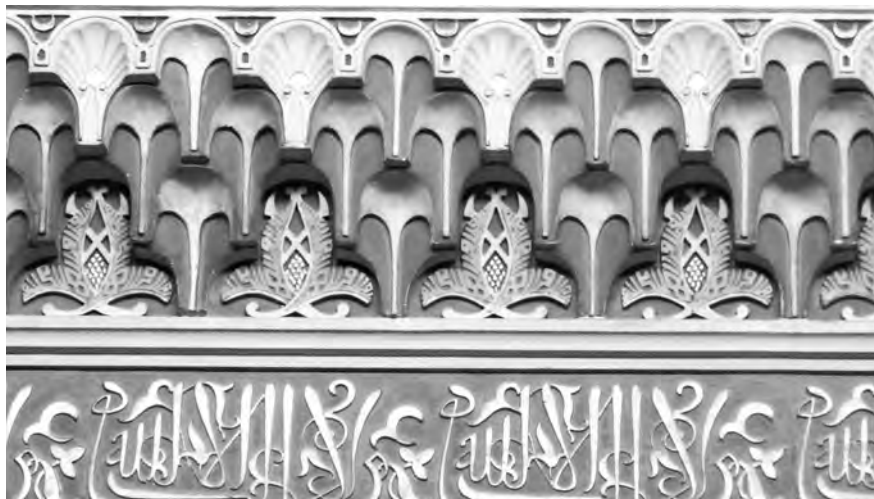
Sanefa amb cal·ligrafia cúfica, coronada per un mocàrab o superposició de prismes.

L'edifici resulta encisador per la seva genuïna combinació d'estils: a l'exterior hi predomina la línia clàssica, mentre que a l'interior la filigrana orientalista hi confereix el to solemne i decorós exigít per la posició social dels propietaris, sense renunciar a l'artifici i l'espectacularitat de l'estil moresc. En accedir-hi és difícil no deixar-se seduir per un ambient de somni inspirat en l'Alhambra de Granada.