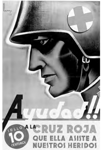
Cartell per a la Creu Roja dissenyat per Henry, 1937.

El 24 d'abril de 1946 arribà al port de Barcelona el mercant