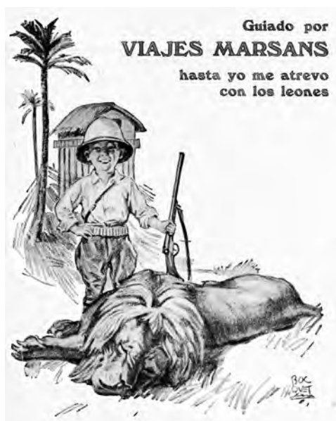
Anunci de Viatges Marsans a la Revista de Oro el març de 1926.

Tanmateix, aquest no seria l'únic infortuni que coneixeria aquesta mena de caprici exòtic i opulent, pensat per a l'esbarjo d'una família benestant. Amb el pas del temps, el conjunt