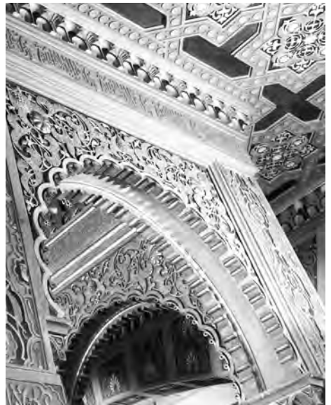
Detall interior del vestíbul de la Casa Marsans.

Anunci publicat a El Progreso Industrial y Mercantil el 20 de novembre de 1903.