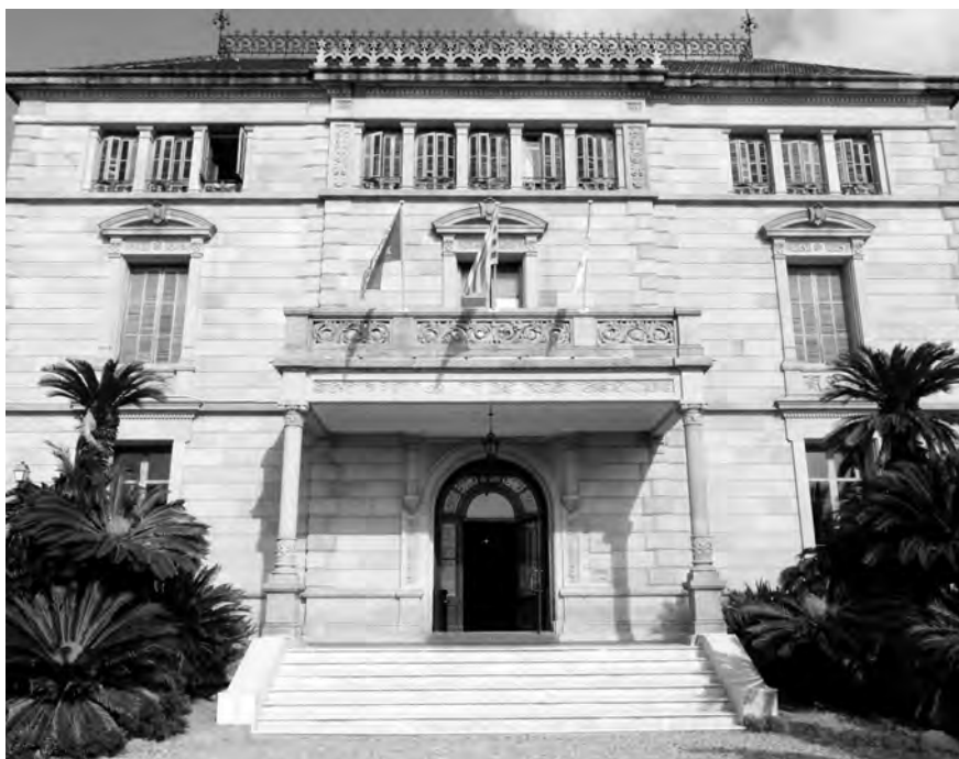
Façana de la Casa Marsans.

L'origen d'aquest singular edifici cal cercar-lo en el desig de la família fundadora de la Banca Marsans, i de la primera agència de viatges d'Espanya, d'aixecar una segona residència a Vallcarca, un nucli aleshores considerat un lloc d'esbarjo de la vila de Gràcia.