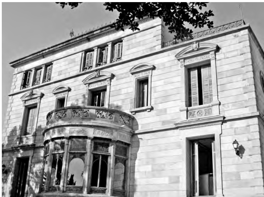
Vista de la façana sud de la Casa Marsans.