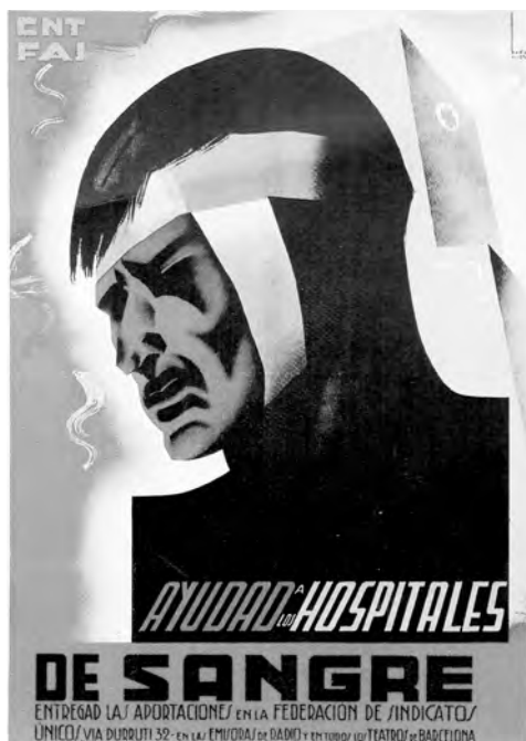
Cartell de Badia Vilato per promoure l'ajuda econòmica per als hospitals de sang, editat el 1937 per la CNT FAI.

residencial tindria altres usos, molt diferents dels que motivaren el projecte original, que ningú no dubtaria a qualificar de sorprenents.