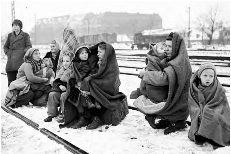
Dones i infants polonesos a l'estació de Lodz, Polònia, al final de la Segona Guerra Mundial.