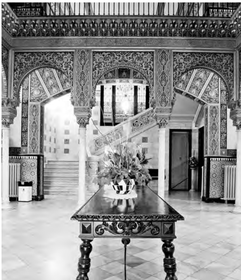
Vista general del vestíbul de la Casa Marsans, el típic sahn , decorat amb motius islàmics.

La planta baixa s'organitza al voltant d'un espai central, el típic sahn , profusament decorat amb motius islàmics, que evoca, com gairebé sempre, el pati dels Lleons del palau granadí. Un peristil de columnes de fust llis, de marbre blanc, sosté una successió d'arcs que limiten amb els paraments de la paret, ricament decorats amb guixeries de formes geomètriques. L'alternança dels colors blau, vermell i daurat s'estén a un fris, resseguit per una sanefa amb cal·ligrafia cúfica que repeteix obsessivament la llegenda Només Al·là és el vencedor , que culmina amb un mocàrab igualment policromat.