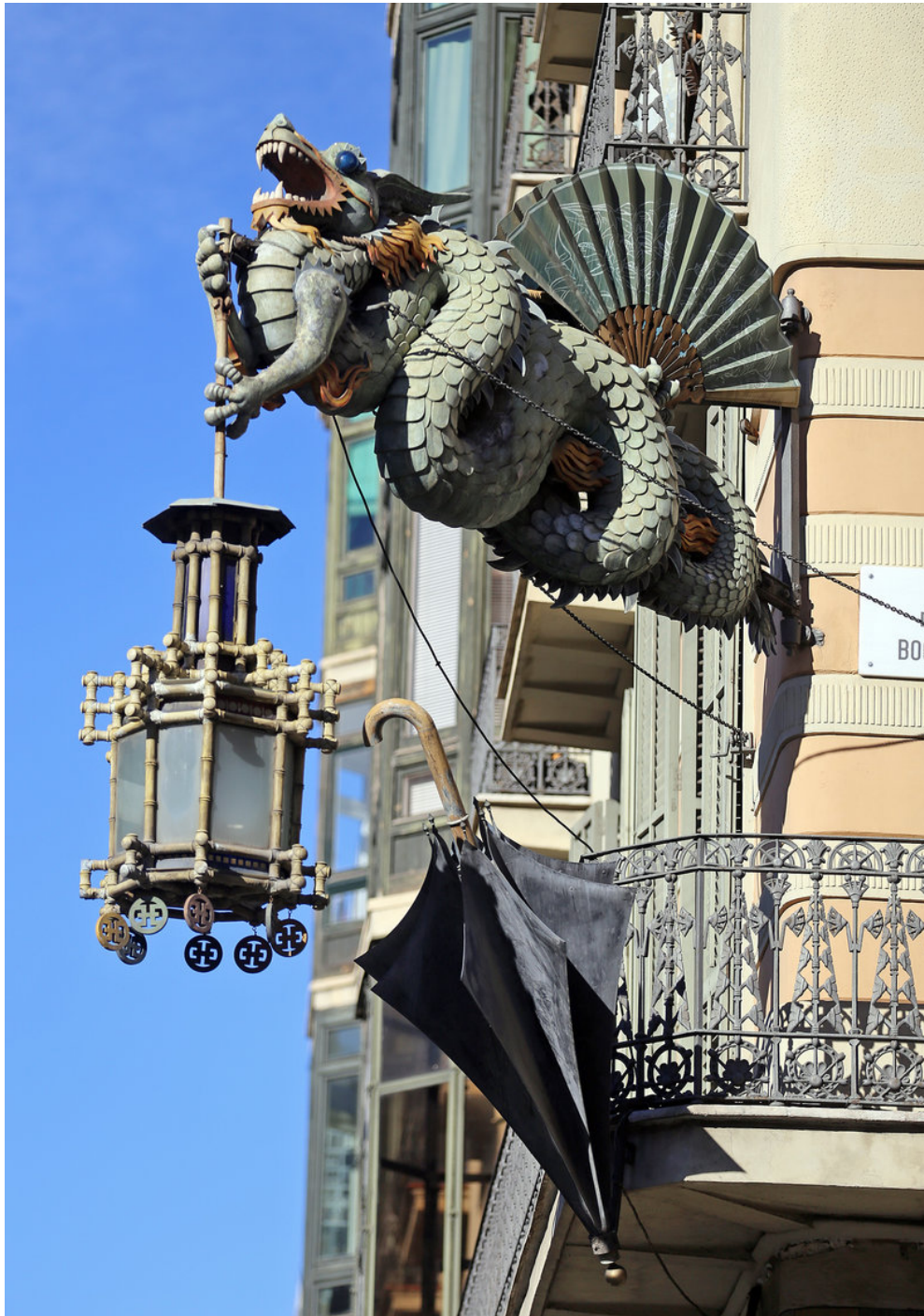
El famós drac de la Casa Bruno Cuadros de la Rambla.