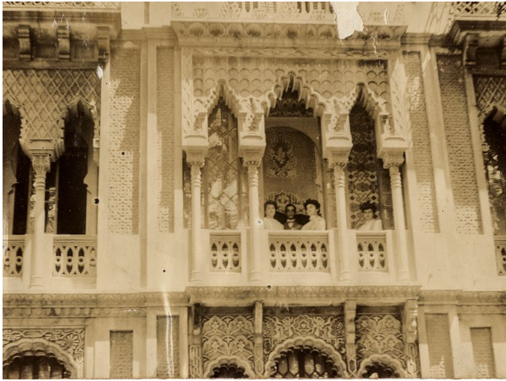
Una fotografia antiga en què es veu tal i com era originàriament la Casa Pere Llibre.