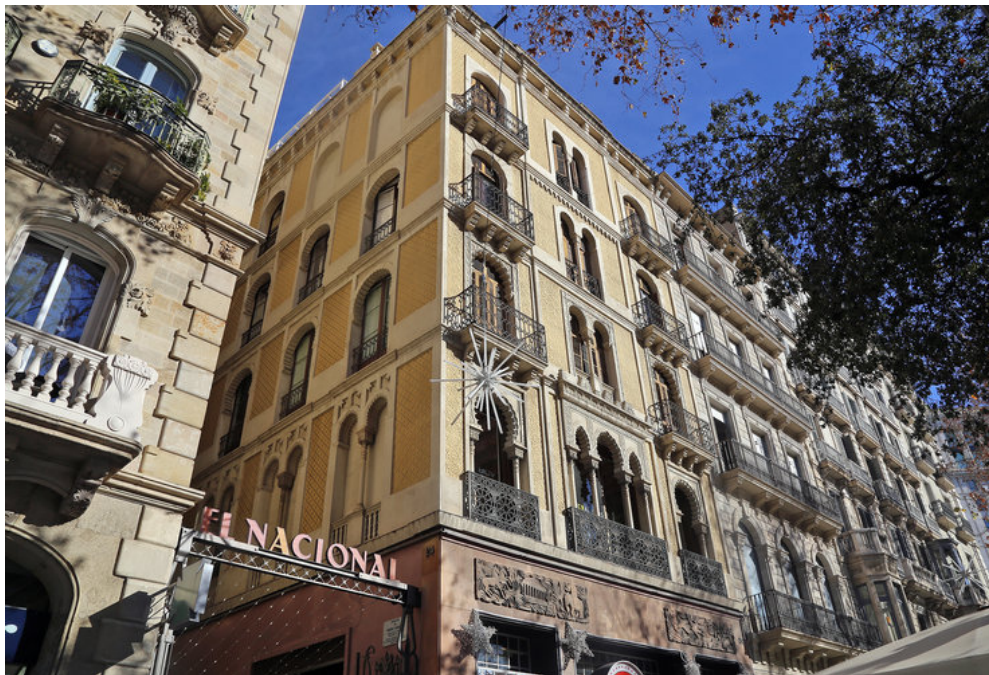
La Casa Pere Llibre del passeig de Gràcia.