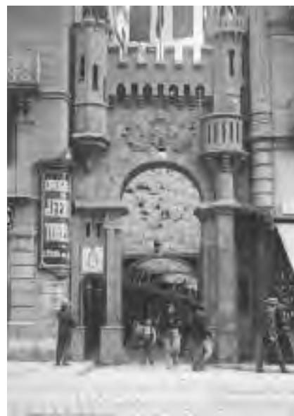
Carrer Comtal.

Naturalment, abundaren les decoracions modestes, fetes a corre-cuita i sense gaire pressupost, carrers senzillament guarnits amb banderoles i garlandes de paper, en els quals s'incidí més en les ganes de gresca que no pas en el vessant artístic. També hi hagué projectes fallits que, per un motiu o altre, no arribaren a temps, com el tram del carrer de l'Hospital comprès entre la