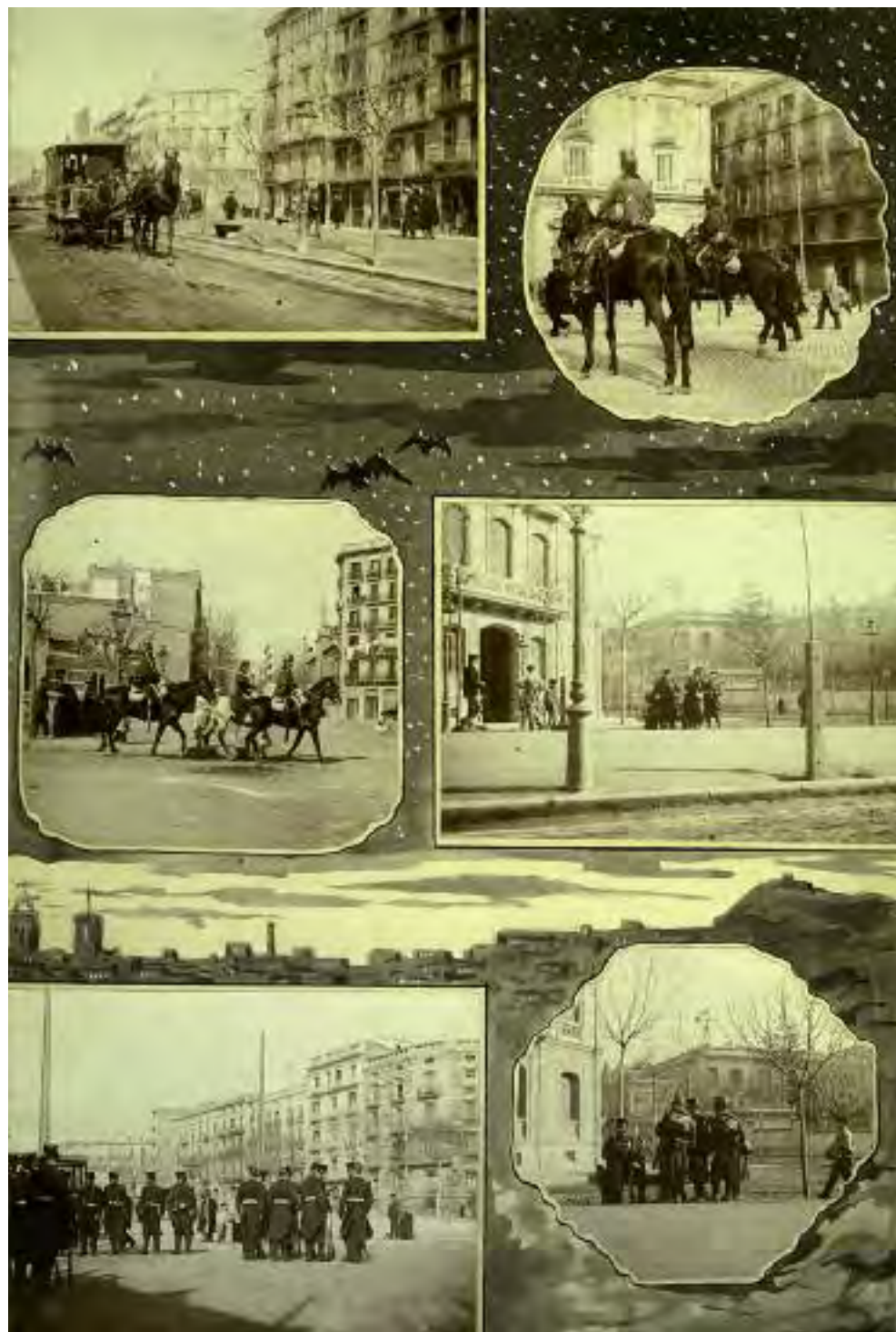
La ciutat ocupada , fotomuntatge del desplegament de tropes durant la vaga de febrer de 1902.