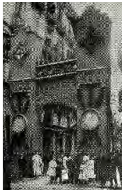
Carrer Nou de la Rambla.