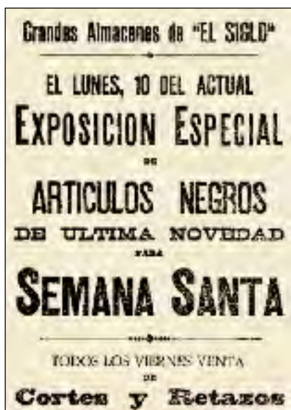
LA VANGUARDIA, 7/3/1902

La vaga de la premsa segons el Cu-cut! , que en el número del 27 de febrer presentava aquests dos ciutadans absorts amb la lectura de The Times , mentre comentaven: Ara sabré lo que va passar avans d'ahir al costat de casa . L'acudit es referia a les notícies fantasioses publicades a la premsa estrangera, com el francès La Dépêche , que va arribar a afirmar que a Sants s'havia produït un gran combat, amb cinc-cents morts entre els revoltats i el barri completament destruït pel foc d'artilleria.