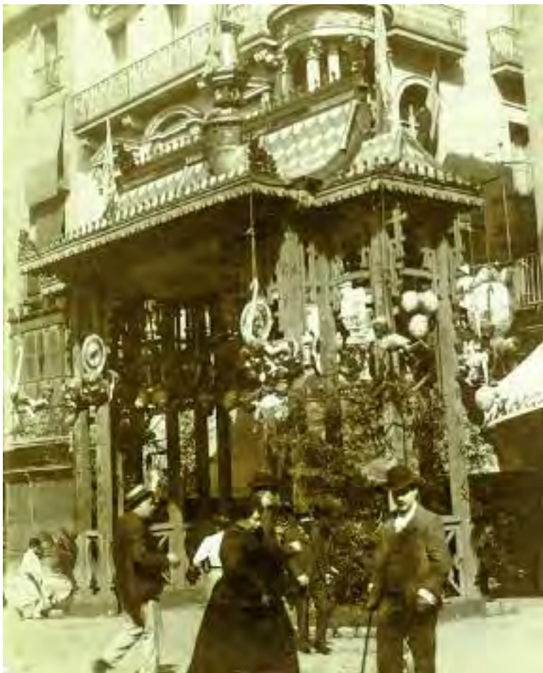
Carrer de la Boqueria.