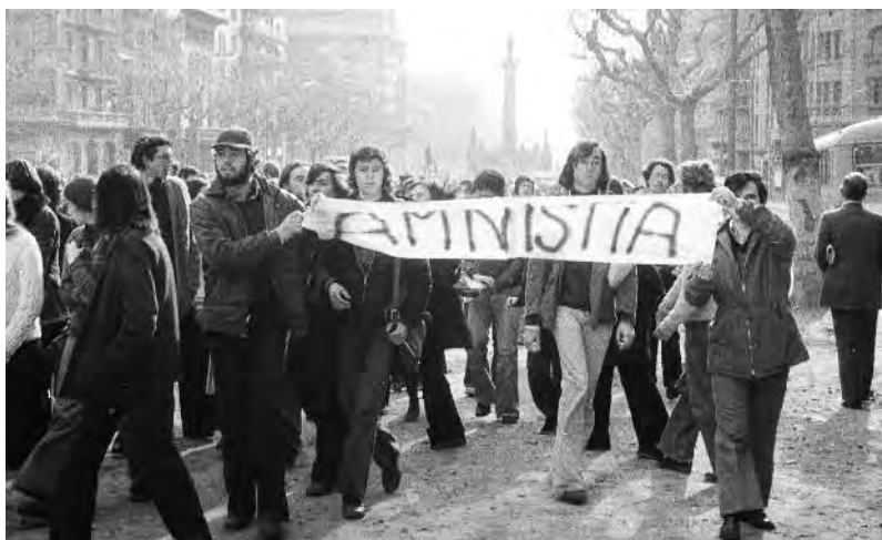
Les reivindicacions de l'Assemblea de Catalunya sintetitzades amb un lema que esdevindria cèlebre: Amnistia!

L 'Assemblea de Catalunya agrupà la gran majoria de l'oposició democràtica catalana, partits, sindicats i entitats socials i culturals, a més de nombrosos artistes, intel·lectuals i professionals de diversos àmbits, amb l'objectiu comú de la recuperació de les llibertats socials, polítiques i nacionals. Fundada el 7 de novembre de 1971 a l'església de Sant Agustí —situada a la plaça del mateix nom, al carrer de l'Hospital—, l'Assemblea de Catalunya, des de la més estricta clandestinitat, esdevindria la plataforma unitària per excel·lència de la lluita anti-franquista durant els darrers anys de la dictadura, amb una sèrie d'accions reivindicatives de gran repercussió.