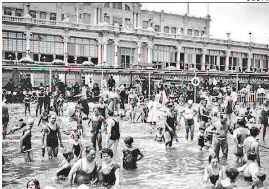
► La platja de Sant Sebastià, el 1925, quan a Barcelona els homes i les dones ja es podien banyar junts.