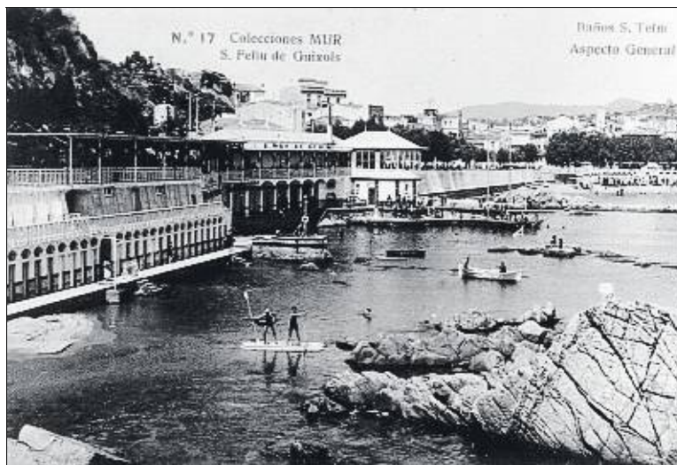
RICARD MUR DARGALLO/FONS JAUME CERVERA BOSCH

Arribada el 1928 a Sant Feliu d'un dels vaixells procedent de Barcelona que feia els Viatges Blaus per descobrir la Costa Brava