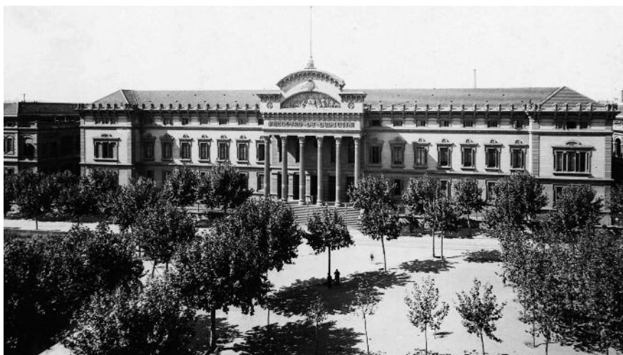
Postal d'autor desconegut de l'Hospital Clínic i la Facultat de Farmàcia, cap al 1930.