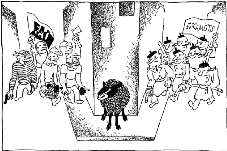
Vinyeta de Tísner publicada a El Be Negre el 25 de juliol de 1933, que mostra la situació de la revista, amenaçada a banda i banda pels esbirros de la FAI i els escamots.

Cal no enganyar-se: aquest focus criminal no ha desaparegut, és ben viu encara. Es diferencia dels pro-