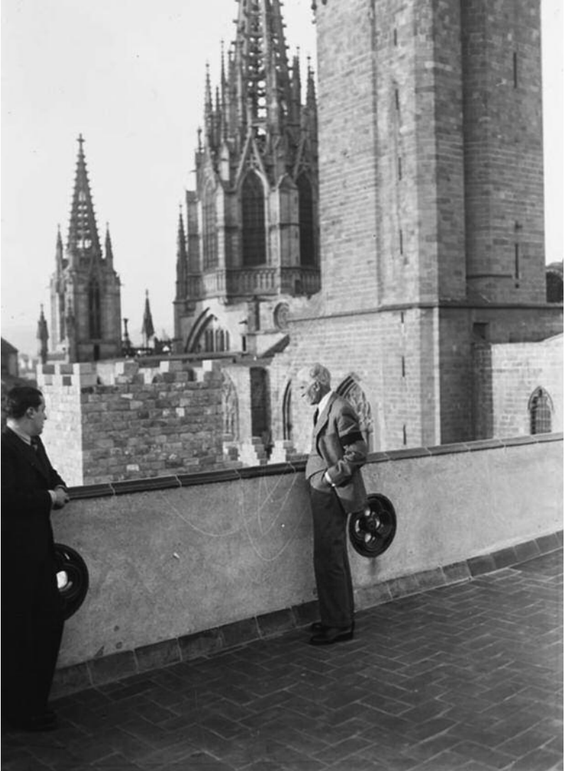
Francesc Macià, president de la Generalitat de Catalunya, al terrat de la Casa dels Canonges. A l'esquerra, es pot veure el periodista Josep Maria Planes, en una fotografia inclosa en un reportatge de la revista Mundo Gráfico , el desembre de 1932.

me. Planes, que s'adherí de molt jove als ideals catalanistes, que fou perseguit per catalanista i per catalanista va morir, fou mal conegut pels seus adversaris. No era pas l'enemic de la classe obrera que alguns volgueren,