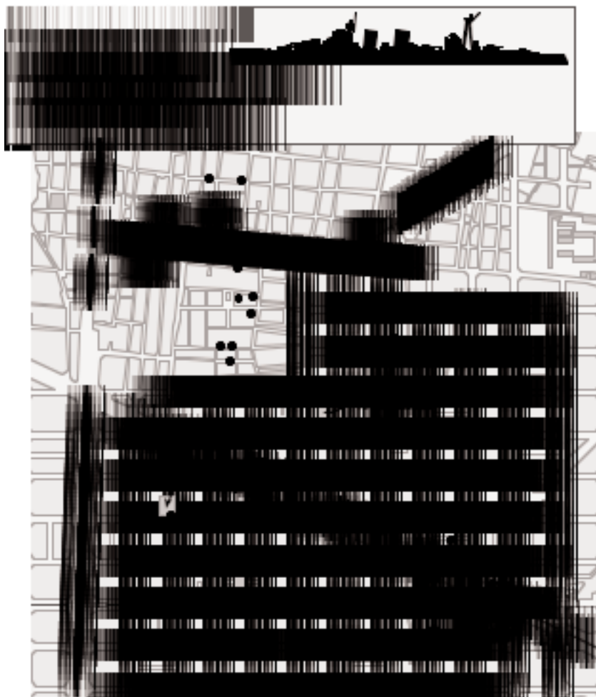
ELS IMPACTES PRODUITS MOSTREN LA TRAJECTÒRIA DELS PROJECTILS DISPARATS PEL CREUER ITALIÀ, SITUAT A L'ALÇADA DEL POBLENOU, CONTRA LES FÀBRICUES D'ARMAMENT.

put abans la part final d'algunes trajectòries. Un cert nombre de trets mostra, per contra, una imprecisió major.