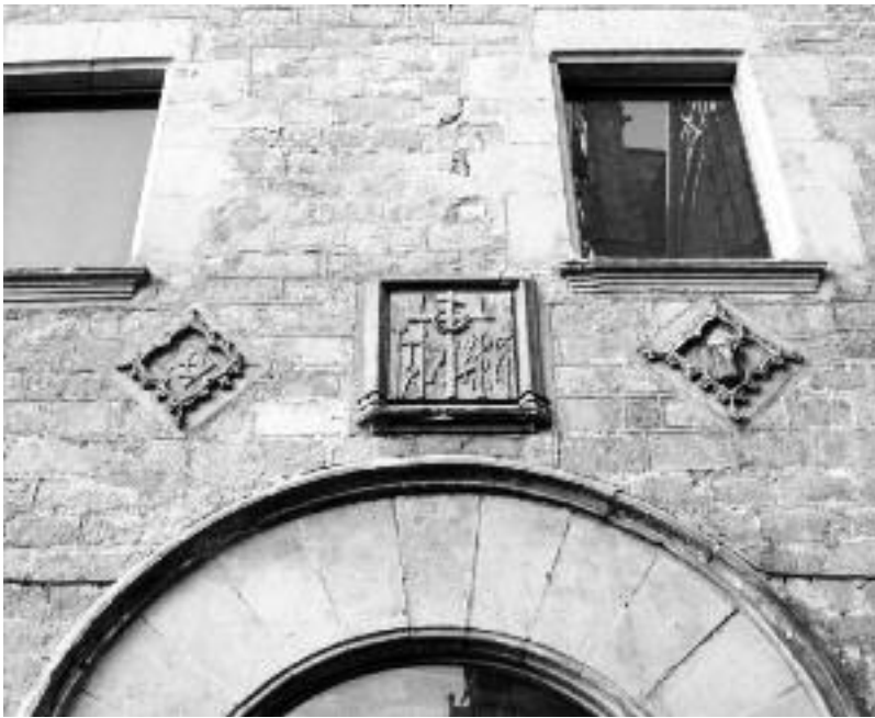
La Pia Almoïna.

Prop de les Drassanes s'alçava l'Hospital de Sant Nicolau (7), un casalot de pelegrins que, segons la tradició, va acollir sant Francesc d'Assís quan feia el camí de Sant Jaume, l'any 1214. Aquest fet va propiciar que en aquell indret s'hi construís més endavant un convent de franciscans, conegut per Framenors, enderrocat el 1837 poc després de la desamortització de Mendizábal.