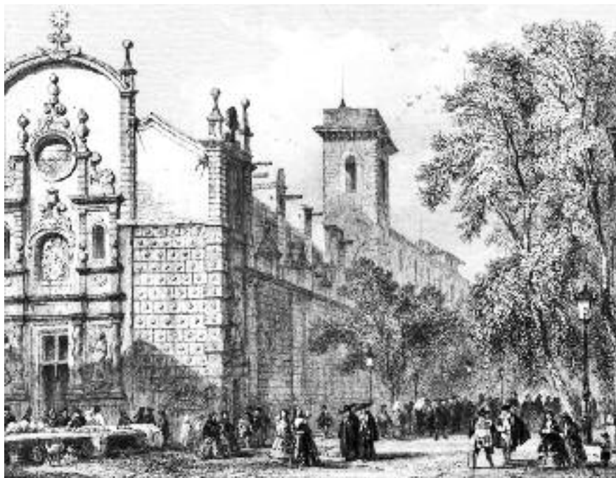
La rambla dels Estudis i l'església de Betlem, el 1845. Gravats de MM. Rouargue inclòs al seu Voyage pittoresque en Espagne et en Portugal .

En aquell indret, a l'aire lliure, el mestre dictava la classe d'anatomia, normalment d'acord amb els textos de metges clàssics, que eren en llatí. En ocasions, l'encarregat de llegir era un lector, que deixava el catedràtic sense altra feina que seure a la seva cadira. Hi actuava igualment un demostrador,