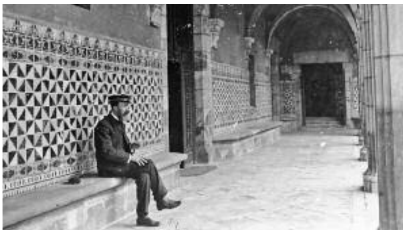
Home assegut al banc de l'arrambador del claustre de la Casa de Convalescència, a principi del segle XX. (Autor: Josep Maria Armengol)

—Qui va ser en Pau Ferran?, pregunta encuriosit.