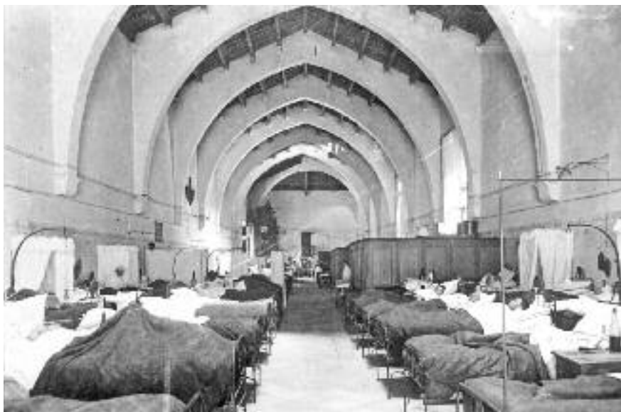
Sala col·lectiva de l'Hospital de la Santa Creu, poc abans del seu trasllat.

tilla. Cirurgians i apotecaris també es van afegir a l'equip mèdic, fins a constituir una institució sanitària de gran prestigi, escenari d'un gran nombre de proves i descobriments mèdics i científics.