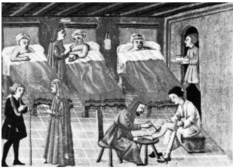
Un hospital medieval.

Durant l'edat mitjana, la proliferació de pobres —és a dir, tothom que no podia sobreviure per si sol, inclosos infants orfes o abandonats, vells i malalts— havia esdevingut un problema greu i, per acollir-los, van sorgir diverses institucions arreu de la ciutat. Les persones refugiades en aquests hospitals medievals, precisament per la seva condició de pobres, eren les més exposades a les malalties i, per tant, els calia ajut mèdic. Els metges atenien a domicili els pacients rics —els que s'ho podien pagar— i després alguns anaven als hospitals per atendre els pobres de manera altruista, sense cobrar però amb un guany per al seu prestigi social. Amb el temps, aquells indrets de caritat, on s'oferia poc més que una màrfega i una senzilla ració alimentària, van esdevenir espais curatius.