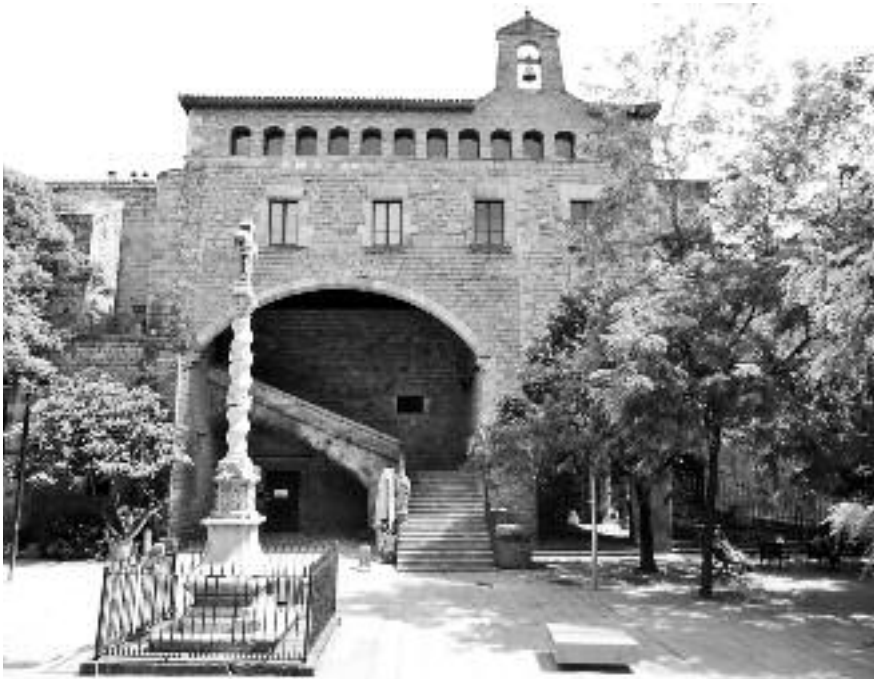
Imatge exterior de l'Hospital de la Santa Creu.

La llarga trajectòria de l'Hospital de la Santa Creu és un testimoni clar de l'esmentat procés de transformació en centre eminentment sanitari. En el llibre de pagaments hi ha una partida de l'any 1672 en què consta que al metge de casa li era prohibit d'assistir fora de l'hospital, una dedicació exclusiva que, amb el pas del temps, requerí més i més metges a la plan-