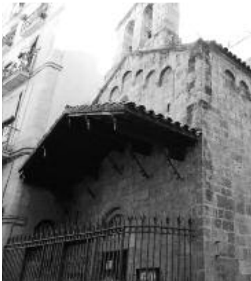
La capella de la Mare de Déu de la Guia, o d'en Marcús.

N'és un exemple l'Hospital del Canonge Colom (2), del qual, com en el cas anterior, només n'ha sobreviscut la capella, emplaçada a la cantonada del carrer de l'Hospital amb la plaça del Canonge Colom, a tocar de la plaça de la Gardunya. Actualment, acull la denominada Sala Capella, un espai destinat a exposicions,