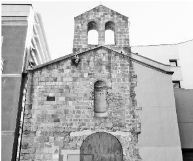
La capella de Sant Llàtzer, a la plaça del Pedró.

L'Hospital dels Mesells va ser en aquest indret fins al 1904, quan va ser traslladat a la masia de Can Masdéu, a Horta. Havien passat molts segles, però els leprosos seguien en