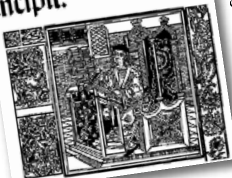
Frontispici de la Concòrdia dels apotecaris de Barcelona .

Concordie apothecariorum Bar chin. i medicinis Co positis Liber feliciter incipit.