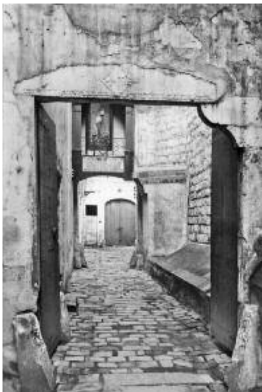
El Corralet de l'antic Hospital de la Santa Creu.

Durant l'edat mitjana, els metges barcelonins estudiaven en els anomenats Estudis Generals (11), que eren al capda-