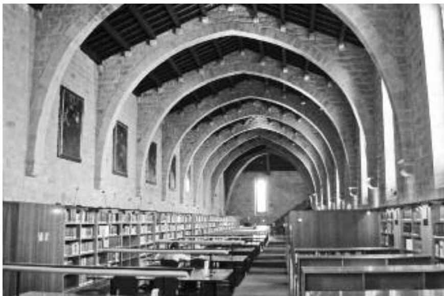
L'actual Biblioteca Nacional de Catalunya, en la mateixa nau.

de teatre. Al pati podem admirar la creu central que simbolitzava la Santa Creu, les escales que conduïen a l'ala dels homes, presidida per sant Roc — sant venerat com a lluitador contra la pesta— i les d'accés a la de les dones, presidida per la mare de Déu dels Desemparats. També hi ha una gran reixa de forja, rere la qual hi ha la farmàcia de l'hospital, de la qual parlarem tot seguit.