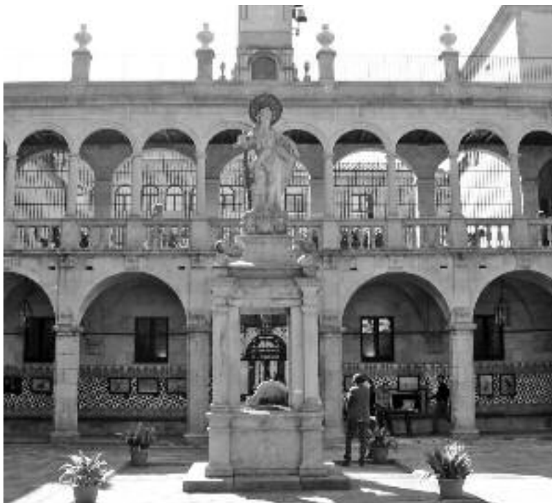
Pati de la Casa de Convalescència, seu de l'Institut d'Estudis Catalans.