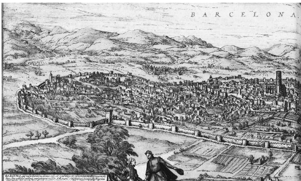
Vista sobre Barcelona des de Montjuïc. En primer terme, la muralla del segle XIV i, en segon terme, la muralla del segle XIII. S'hi identifiquen alguns edificis, com ara la Catedral, Santa Maria del Mar o les Drassanes Reials, amb l'espai del Raval entre totes dues muralles. | BARCINO, QUAE VULGO BARCELONA DICTUR , 1572 (BNE)

carrers que, amb la seva denominació, assenyalen antigues portes de la muralla. Per exemple, el Portal de l'Àngel, perquè suposadament en aquesta porta va aparèixer un ésser alat al segle XV (encara hi ha una còpia d'aquest àngel en una fornícula encastada al segon pis de l'edifici del Banco de España); o el Portal Nou, perquè va ser l'últim portal que es va construir en aquesta muralla.