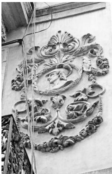
Elements de terracota en un edifici del carrer del Call.

Així, per exemple, una modificació de la normativa de l'any 1846 permetia construir immobles amb tres pams (mesura oficial en aquell moment) extres, per arribar fins als cent, a todas las fachadas de edificios cuyo buen gusto arquitectónico y riqueza en los adornos las hagan dignas de esta concesión ( Bando de Buen Gobierno o de Policía Urbana para la ciudad de Barcelona de 1843 ). Aquesta