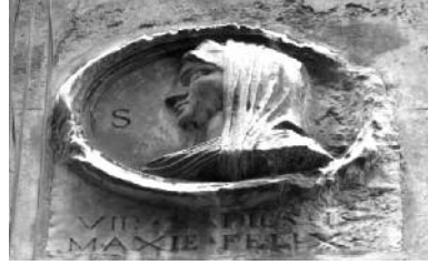
Medallons d'època renaixentista.

muralla i dues torres que són visibles des de 2018 (8). En aquest punt no cal seguir baixant perquè la muralla romana deixa de ser visible, però és bona idea seguir pel carrer del Bisbe Caçador per trobar un interessant llenç de muralla ocult, que es correspon amb la part interior i les torres que hem vist al parc. Per arribar a aquest pany de muralla cal tornar a l'esquerra per arribar al carrer de Lledó 7 (9), on hi ha el Mercer Hotel, amb panys de muralla a la zona del bar i del restaurant. L'interior de l'hotel també alberga una torre de vigilància i fins i tot s'hi pot observar la porta tapiada de l'antic camí de ronda que unia les diferents torres de vigilància.