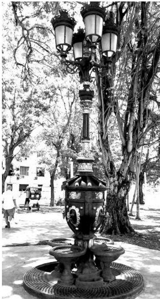
Font de Canaletes a la plaça de Catalunya de l'Havana, Cuba.

Hi ha dues fonts, una a cadascun dels extrems del passeig de la Rambla, instal·lades a finals del segle XIX per commemorar l'Exposició Universal de Barcelona de 1888, ambdues amb una història molt particular.