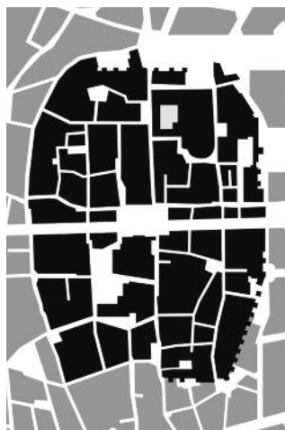
El perfil de l'antiga Barcino es reconeix en el plànol de la ciutat actual.

Aquesta primera muralla encerclava una petita península al costat del mar, el punt més elevat de la qual era el mont Tàber (carrer del Paradís, 10). La muralla tenia una alçària de nou metres i feia dos metres d'amplada. El seu perímetre total era de 1.135 metres.