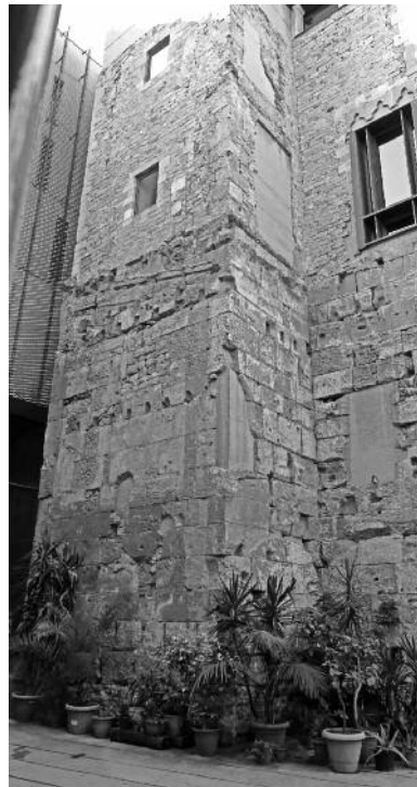
Torre romana al Casal de la Gent Gran del Pati Llimona.