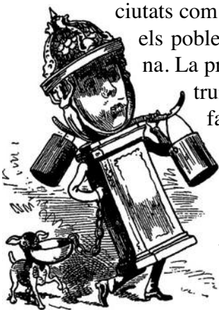
Caricatura de Sir Richard Wallace.

La idea va ser d'un milionari britànic, Sir Richard Wallace, que la va fer fabricar a centenars i la va regalar a diferents ciutats com a símbol de la concòrdia i la pau entre els pobles després de la Guerra Francoprussiana. La primera font d'aquesta mena es va construir l'any 1872 i actualment continuen en fabricació. A Barcelona van arribar-ne dotze, el 1888, amb motiu de l'Exposició Universal. En el darrer recompte només en restaven dues o tres (el nombre varia en funció de la font... bibliogràfica). L'altra desena està en parador desconegut.