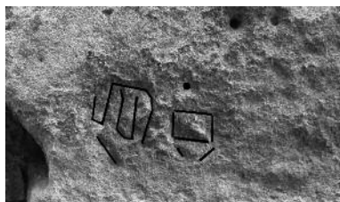
A l'esquerra, marca a la muralla del carrer del Bisbe de la Legio IIII Macedonica. A la dreta, interpretació dels traços.