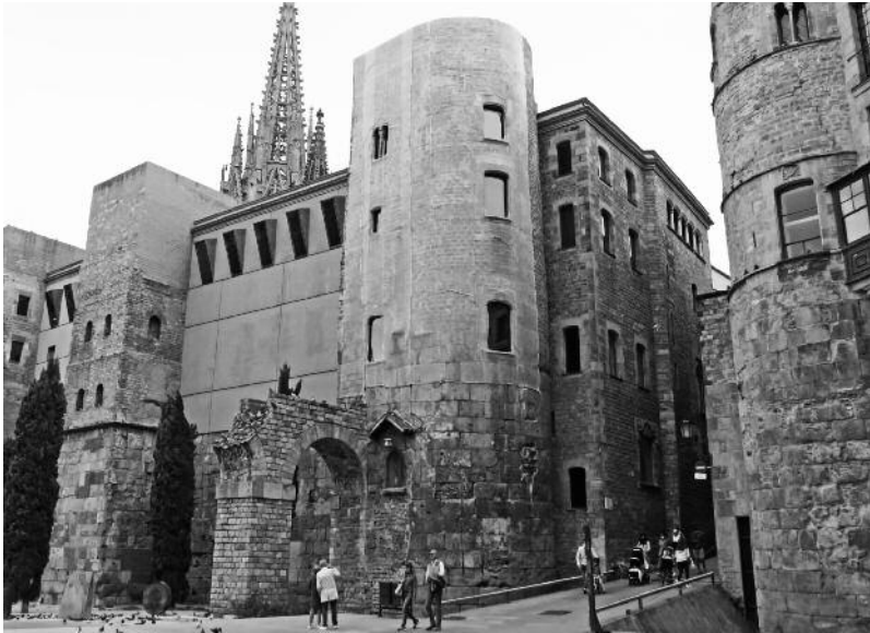
Torres de vigilància a la plaça Nova.

relleu del feix) i dues torres circulars (4), que es corresponen amb un portal, al qual tornarem quan comentem els accessos a Barcino. Aquesta muralla es pot veure per ambdós cantons. Per a això cal anar a l'altre costat, al carrer de Santa Llúcia, 1, i accedir a l'Arxiu Històric de la Ciutat de Barcelona (Casa de l'Ardiaca). Cal travessar el pati i entrar a l'edifici (és públic, només cal accedir-hi respectuosament). Des de dintre es pot veure la cara interior de la muralla (5), així com part de l'arcada i el pilar de cadascun dels dos aqüeductes que arribaven a Barcino.