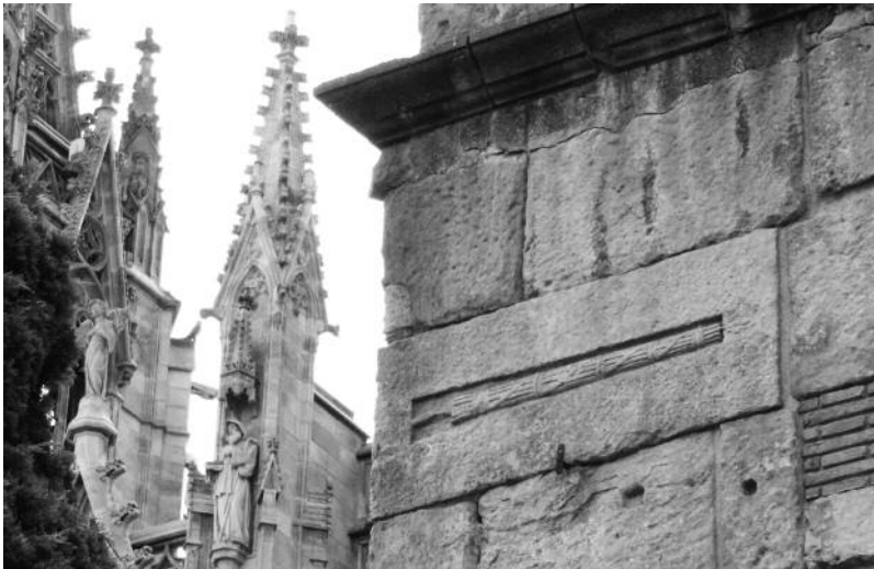
Feix a la muralla, al costat de la façana de la Catedral.

Per construir-les es van reaprofitar materials dels monuments funeraris i religiosos, ubicats a l'exterior de l'antiga muralla del segle I, que es van haver d'enderrocar per poder