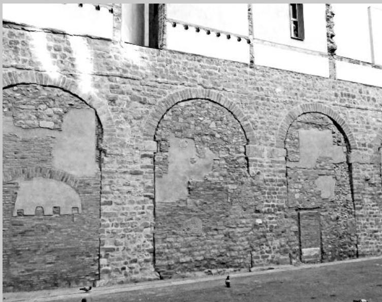
Restes de l'aqüeducte romà a la plaça del Vuit de Març.

L'aqüeducte desaguava en un dipòsit ( castellum aquae ), a prop del lloc més alt de la ciutat, el mont Tàber (16,9 metres sobre el nivell del mar) i, des d'aquest, es dividia en diversos canals, alguns dels quals eren d'aigua potable. L'aigua circulava per conductes pressuritzats de plom ( fistulae plumbea ) fins a les cases ( domus ) que havien pagat l'impost corresponent per disposar d'aquest servei. Altres canals es dirigien a l'àrea industrial (que es pot visitar actualment sota la plaça del Rei) en què hi havia factories que necessitaven aigua abundant per als seus processos productius. Els negocis allà instal·lats van ser diversos: des d'una fullonica (bugaderia i tintoreria) al segle II fins a una cetaria (conserva de peix), i una instal·lació de vi al segle III. Finalment, altres canals no pressuritzats es dirigien a diverses àrees termals i a fonts públiques gratuïtes.