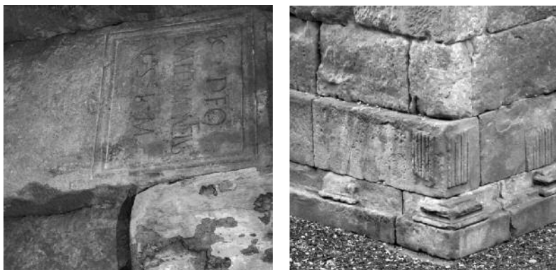
Elements reutilitzats en la muralla romana.

fer-ne l'ampliació. Per aquest motiu és possible identificar-hi elements reciclats, com ara relleus de feixos (2) (insígnies pròpies dels magistrats municipals en època romana) o altres elements decoratius.