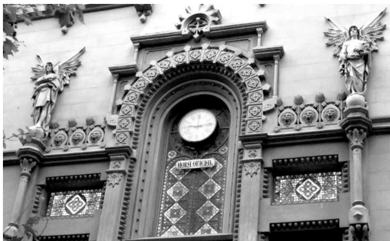
Relotge de la façana de la Reial Acadèmia de Ciències i Arts de Barcelona, a la Rambla.

En aquella època era molt complicat saber l'hora, ja no diguem l'hora exacta. Aquest fet comportava problemes quotidians molt diversos en activitats que començaven a ser rutinàries, com la sortida d'un tren o la finalització de la jornada