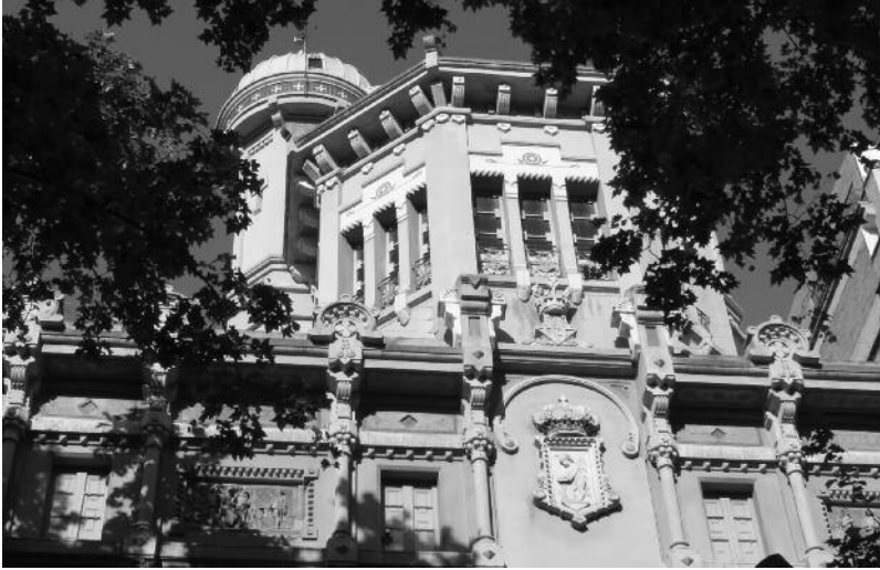
Una de les torres d'observació astronòmica de la Reial Acadèmia de Ciències i Arts de Barcelona.

de treball (Thompson, 1989). Els canvis associats al procés d'industrialització i les novetats tecnològiques van suposar un canvi en l'organització del temps que requeria cada vegada major sincronització i precisió horària.