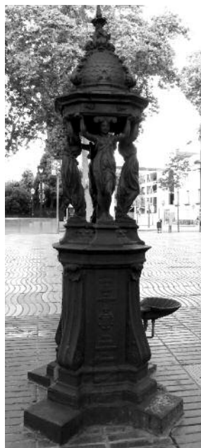
Font Wallace a la Rambla, davant del Museu de Cera.

La font, amb quatre cariatides que sostenen una cúpula amb quatre peixos, disposava originalment d'un