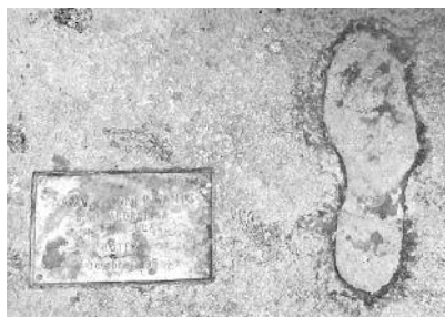
Petjada de Pasqual Maragall a la plaça de Cucurulla.

Abans d'abandonar la Rambla, és necessari ressenyar l'existència d'altres petjades, aquestes literals, gravades al marbre a cop de taló per prostitutes anònimes, que impactaven