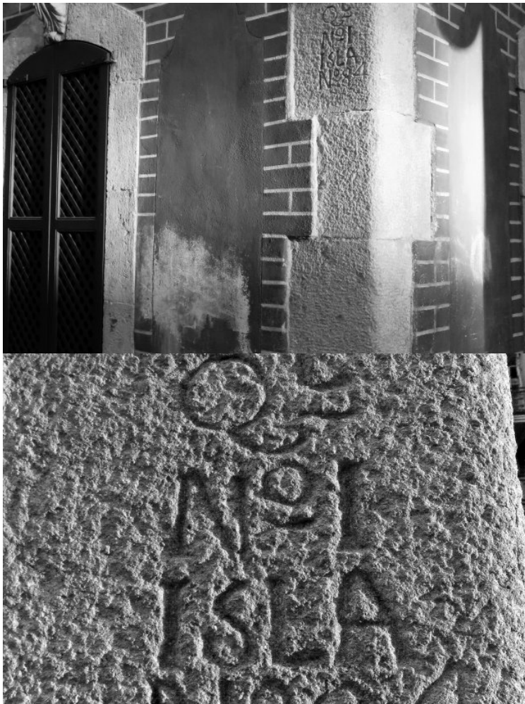
En un edifici original de la Barceloneta, al carrer de Sant Carles, encara es poden veure les marques de referència de cada illa / Albertí Editor

Per fer-ho, n'hi ha prou de localitzar, tot baixant o pujant per la Rambla, un seguit de grups de fanals de cinc braços . Resulta que estan col·locats precisament allà on hi havia els antics portals de Santa Anna, de Portaferri, de la Boqueria, de Trencaclaus i de Sant Francesc . O que a la rampa d'accés al pàrquing de la plaça del Teatre es conserva un llenç de muralla. Pel que fa a la segona muralla medieval, la del segle XV i que engloba també el Raval, segons l'autor encara es pot veure fugisserament un tros quan "s'utilitza l'ascensor que baixa a l'estació dels ferrocarrils de la Plaça de Catalunya" o, previ pagament de l'entrada, al cèlebre i alhora sòrdid Bagdad Club .