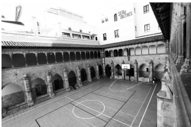
El claustre del gòtic del monestir de Santa Maria de Jerusalem, originalment situat a l'actual plaça de la Gardunya, actualment forma part del col·legi Sant Miquel, al carrer Muntaner / Alberti Editor

I encara una última mentida com a colofó de tot plegat. La suposada sinagoga major de Barcelona del carrer Marlet , descoberta a finals del segle XX, no és tal segons l'autor d'aquest llibre, que recorda que " hi ha evidència documental que en realitat era al carrer de Salomó ben Adret, 9 ", és a dir, molt a prop però no al mateix lloc. En tot cas, i més enllà de la discussió que tot plegat pugui suscitar, el fet és que el llibre és una font de detalls que sovint passen per alt.