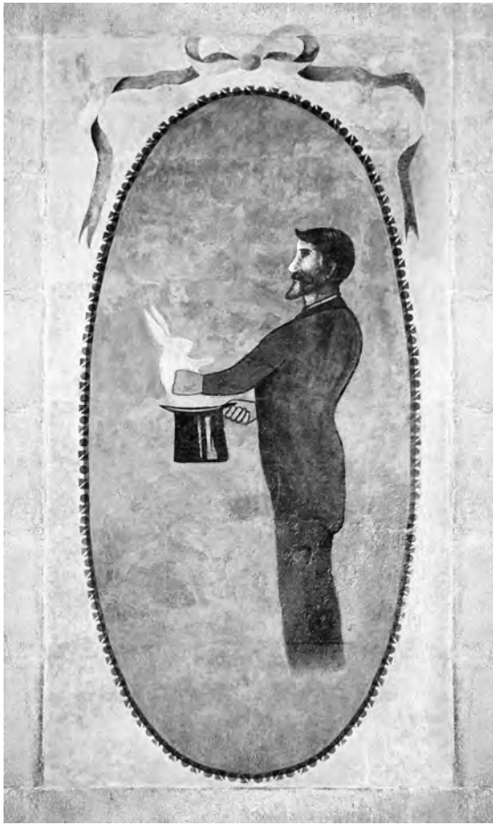
Cartell publicitari del mag Fructuós Calonge, que encara sobreviu a la plaça Reial / Albertí Editor

Altres cicatrius de Ciutat Vella són tan grans que poden arribar a passar desapercebudes precisament per això, es tracta de grans reformes urbanístiques, 'urbicidis' en diu l'autor , com ara l'eix Ferran - Jaume I - Princesa, obert a mitjans del segle XIX, la mateixa plaça de Sant Jaume, que va suposar enderrocar diversos edificis entre l'Ajuntament i la Generalitat per dotar la ciutat d'un fòrum cívic situat, si fa no fa, on hi havia el centre de la ciutat romana, o la prou coneguda obertura de la Via Laietana , que a principis del segle XX va esventrar completament Ciutat Vella i que encara avui és matèria polèmica.