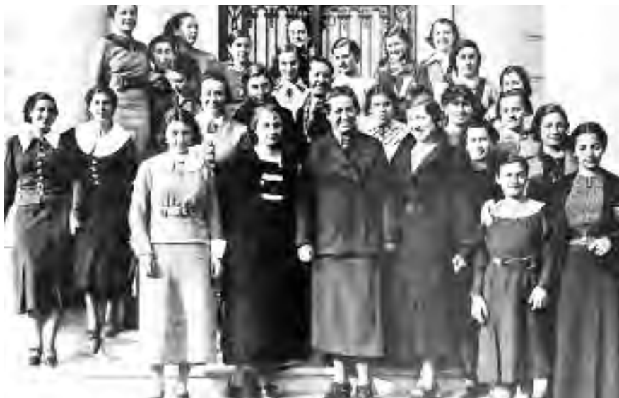
María Luz Morales i Gabriela Mistral a la porta de la Residència de Senyoretas del Palau de Pedralbes, envoltades d'unes quantes joves beneficiàries.

proposà a Morales de ser-ne la directora, càrrec que ocupà en ser inaugurada al Palau de Pedralbes la Residència Internacional de Senyoretas Estudiants, el 1931.