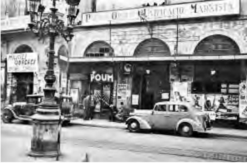
Aspecte de la Rambla els primers anys de la Guerra Civil, amb edificis incautats per formacions polítiques revolucionàries.