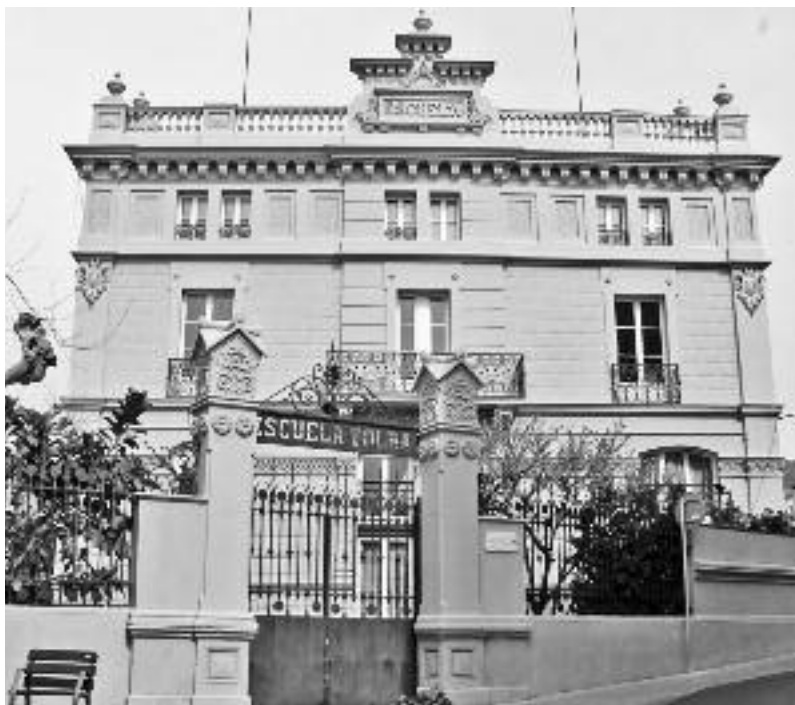
Les antigues escoles Tolrà de Cabriels.