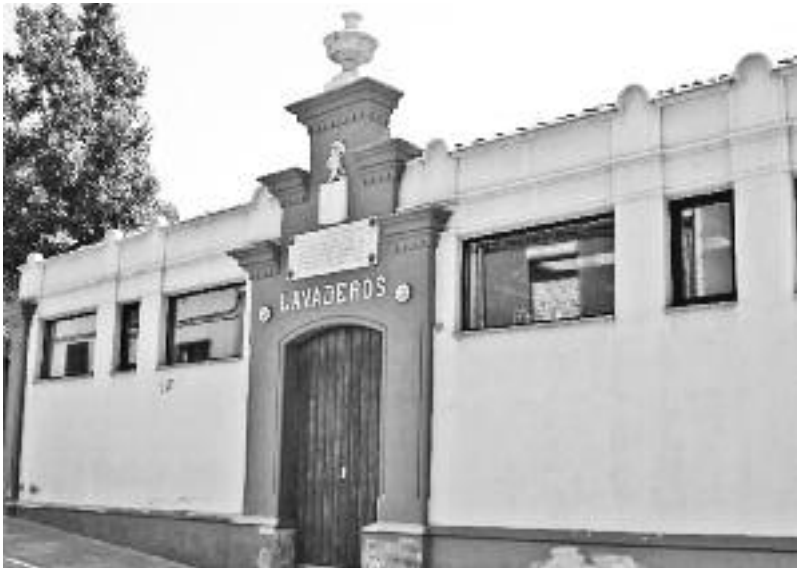
Els safareigs públics de Castellar del Vallès, actual bar Cal Calissó.