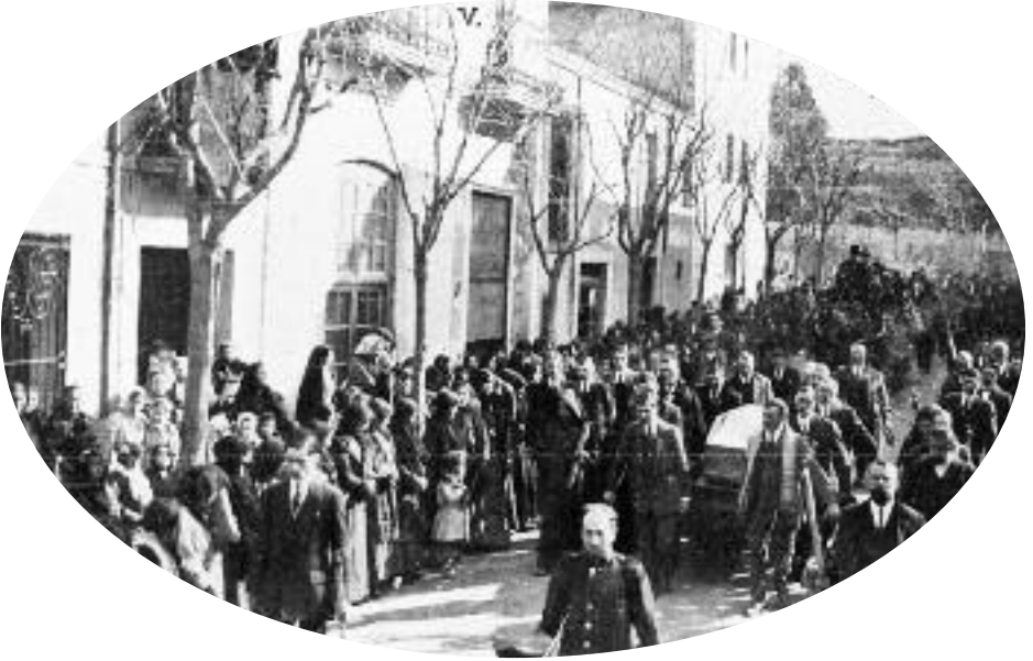
Un carrer de Sant Esteve de Castellar en el moment de passar el fèretre de la il·lustríssima senyora marquesa de Castellar, en una fotografia publicada el 6 de març de 1925 a La Hormiga de Oro . (autor: Baguñà i Cornet)

Castellar y de las poblaciones próximas, deseosos todos de rendir desde el primer instante el homenaje de su dolor y de sus oraciones á la ilustre difunta.