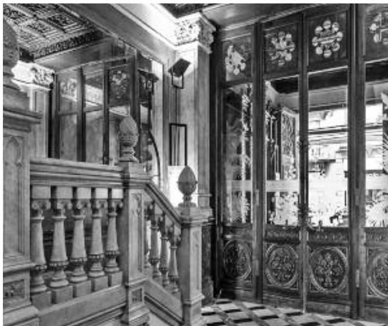
Vestíbul de l'edifici del carrer de Bergara.

ta, en destaquen les portes de fusta cubana, les baranes de forja i la preciosa escala de marbre que condueix al pis principal, un magnífic conjunt arquitectònic transformat actualment en hotel.