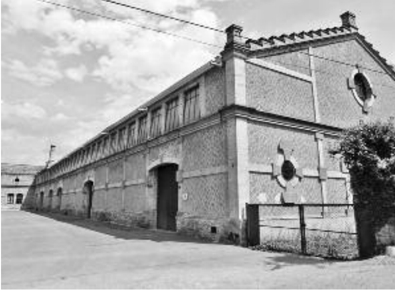
Fàbrica d'Artesa de Segre.

El señor de Tolrà con una amabilidad y sencillez que cautiva dio las gracias á los señores mentados, á la vez que hizo un conciso diseño del régimen y gobierno establecidos en las fábricas de su señora tía la precitada marquesa de Castellar, para venir en demostración de que dando al obrero las condiciones prealudidas, reina siempre la debida armonía entre patronos y obreros, entre el capital y el trabajo.