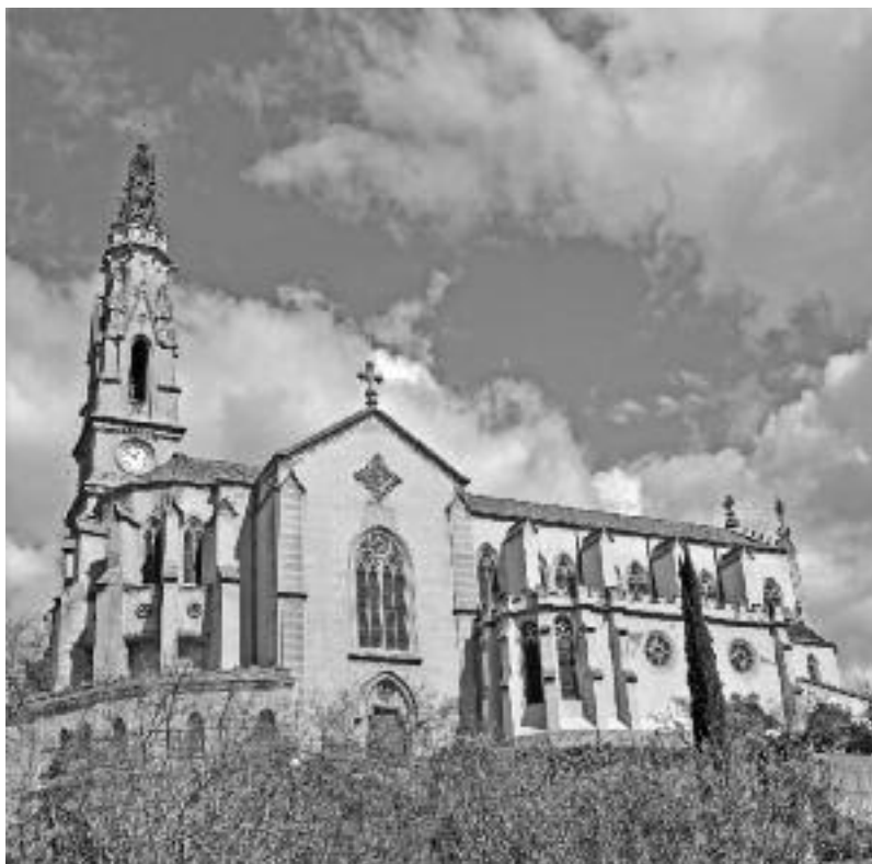
L'església parroquial de Castellà, denominada per la seva magnificència la catedral del Vallès .

Paral·lelament, donya Emília també completà la seva residència, segons un projecte de l'arquitecte Emili Sala i Cortés que dotà amb tot luxe de detalls, tant pel que fa a la decoració com al mobiliari. A la portalada apareix la data de finalització de les obres, el 1890, d'un conjunt que, sense ser-ho, passaria a ser conegut com el palau . La residència pròpiament dita — ja que la finca també disposava de masoveria i galliners— era constituïda per l'edifici principal, una estructura de planta baixa i dos pisos amb finestres, frisos, cornises i frontó d'estil neoclàssic. L'interior també contenia una capella oratori dedicada a sant Josep, mentre que a l'exterior es construí un jardí romàntic, amb glorieta, brollador, pèrgola, jardineres i bancs modernistes. Des del mes de setembre de 1994, la residència