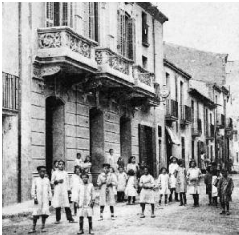
La finca destinada a acollir l'Ajuntament de Castellà del Vallès, a principi del segle XX.

vila. Rere la seva magnífica façana neoclàssica —amb motllures ornamentals, frisos florals, pilastres amb capitells corintis i un frontó amb un rellotge—, es disposaren despatxos i dependències i el gran saló de ball de l'antic cafè es transformà en sala de plens.