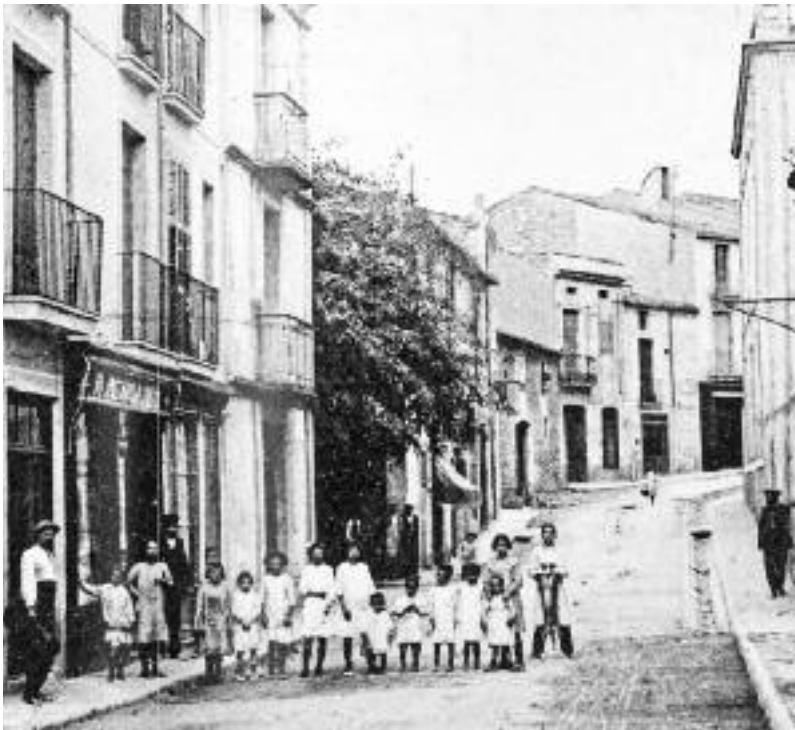
El carrer Major de Castellar del Vallès al primer decenni del segle XX.

La població de Castellar, situada a la vora del riu Ripoll, estava tradicionalment lligada a la fabricació de draps, fins