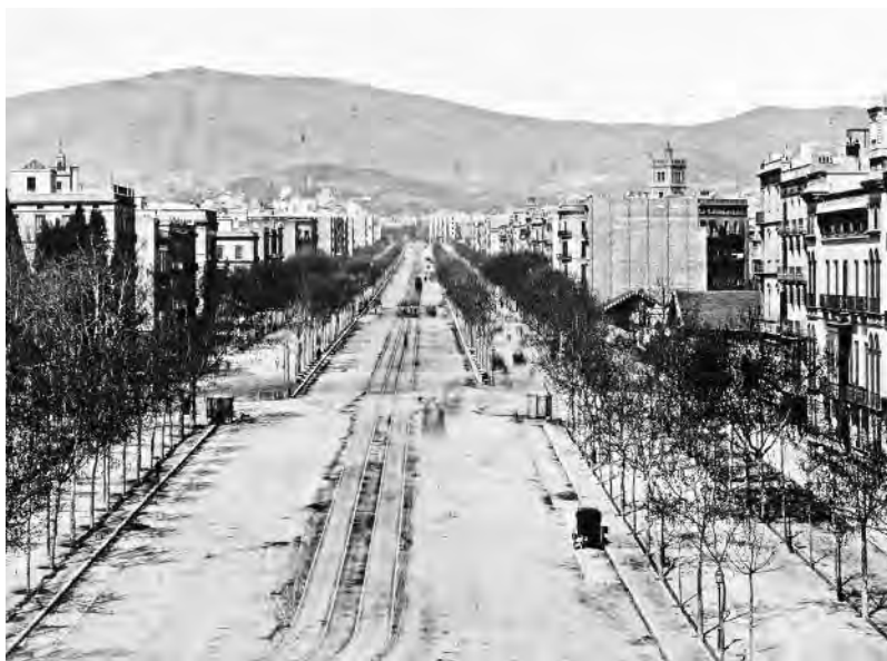
El passeig de Gràcia el 1874, dos anys després de ser instal·lades les vies del primer tramvia de Barcelona.

dició i encant, on calia anar molt ben vestit per ser vist a l'última moda. En canvi, anar allà [a l'Eixample], on tot eren descampats amb quatre cases, no era gens atractiu.