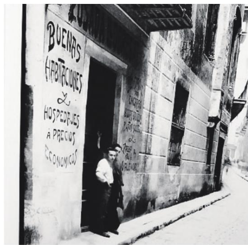
Fonda a Riera de Sant Joan, un carrer que ja ha desaparegut