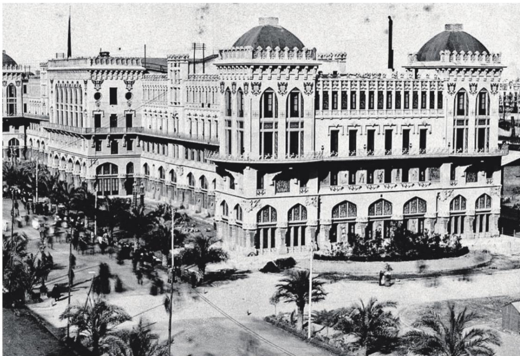
L'hotel Internacional al passeig Colom, construït per a l'Exposició Universal del 1888 i enderrocat després de l'esdeveniment

modernisme català, l'arquitecte Lluís Domènech i Montaner. Amb unes 400 habitacions i 30 apartaments, es va ubicar al passeig Colom, en uns terrenys de 5.000 m 2 cedits temporalment pel port de Barcelona. Després de l'esdeveniment, l'edifici es va enderrocar.