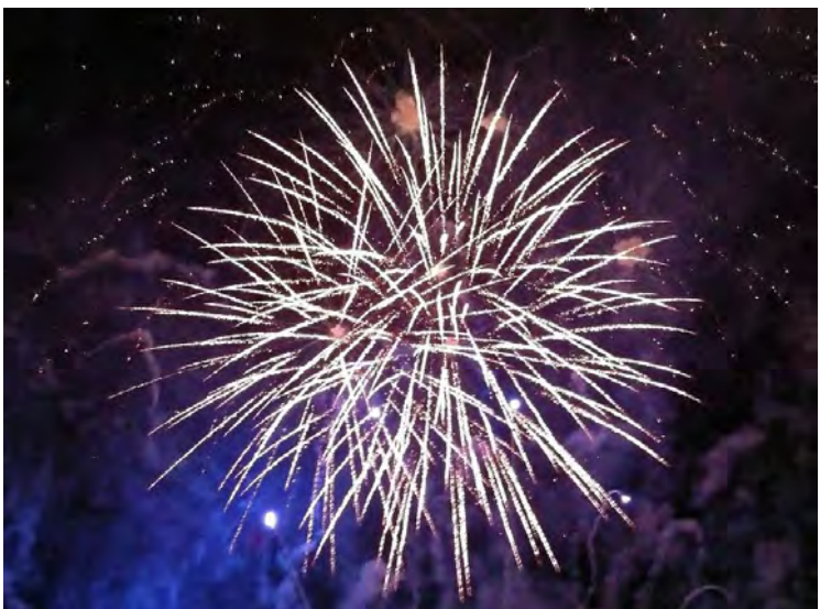
La pòlvora, base dels focs artificials, la van inventar els xinesos. // CC0

Doncs la van inventar els xinesos a principis del segle IX. Era una combinació d'un 75% de salnitre , un 15% de fusta i un 10% de sofre que quan s'inflamava produïa una forta deflagració i que, curiosament, utilitzaven per a pràctiques religioses . Van ser els àrabs els qui van començar a fer-ne un ús militar a partir del segle XIII.