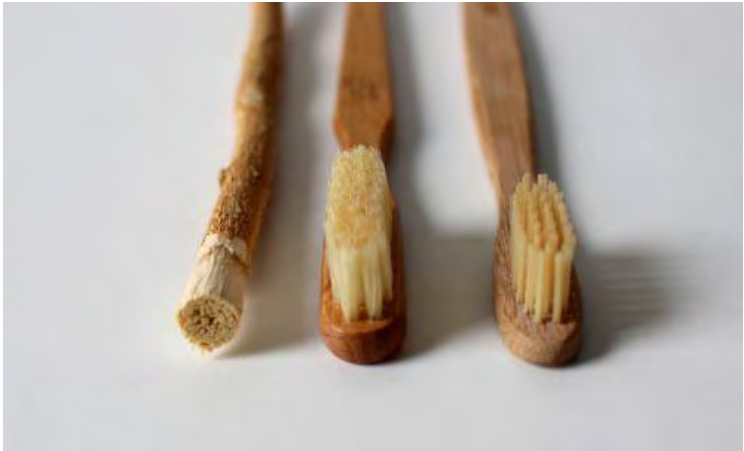
El raspall de dents el devem als xinesos. // CC0

de pèl de crin de senglar de Sibèria amb un mànec d'os destinat a aquesta finalitat.