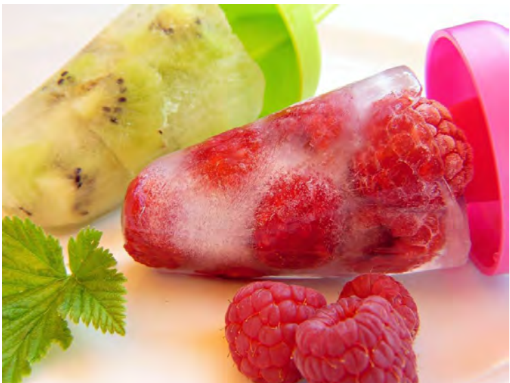
La comunitat inuit va inspirar la congelació habitual dels aliments. // CC0

Molt interessant descobrir que més enllà de l'invent de la nevera elèctrica, les investigacions a l'entorn de la conservació dels aliments es van incrementar gràcies al biòleg nord-americà Clarence Birdseye a partir del 1912 . A la península canadenca de Labrador va observar el mètode de conservació dels inuit: fred, gel i vent congelaven el peix tot just acabat de pescar. I sense perdre els valors nutricionals. El secret era la congelació ràpida i això va reproduir de tornada a Nova York. Uns anys després, al 1924, fundava l'empresa Birdseye Seafood per distribuir filets de peix congelat.