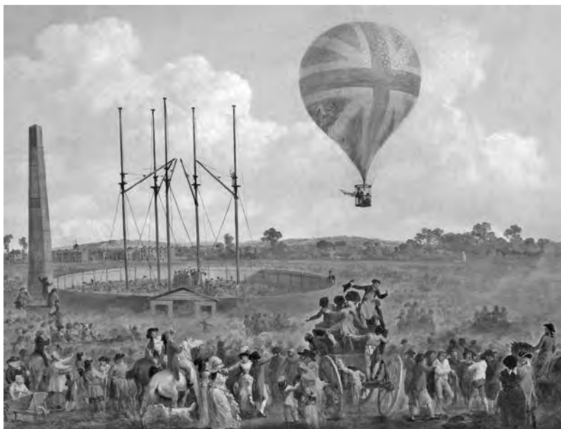
Una de les ascensions de Vincenzo Lunardi a Londres, el 1875, representada pel pintor Julius Caesar Ibbetson.