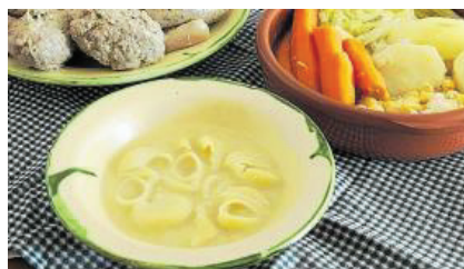
Els calçots, el pa amb tomàquet, la coca de recapte i l'escudella i carn d'olla apareixen en el llibre.