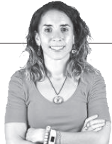
SÍLVIA FORNÓS @silviafornos