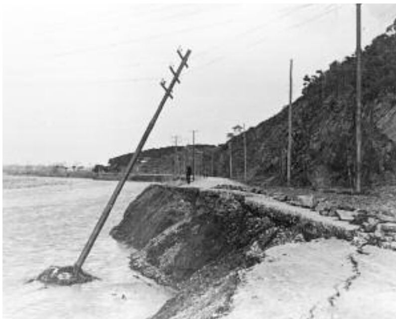
La carretera de la Roca al seu pas per Montcada i Reixac.

La nocturnitat del fenomen i els talls de subministrament elèctric, a causa de la caiguda de nombrosos llamps, van fer que l'aigua agafés per sorpresa bona part de les víctimes, que van ser arrossegades per la riuada als carrers, a casa seva o quan els seus vehicles van quedar aturats. La forta immigració que havia arribat en anys anteriors —i la que arribava en aquell mateix moment a Catalunya— havia afavorit el creixement incontrolat de barris sencers, construïts en zones potencialment inundables. Aquest darrer factor va ser un dels més determinants de la tragèdia.