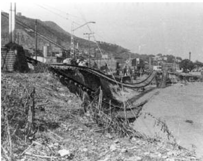
Estat en què van quedar les vies del tren de la línia de França, al seu pas per Can Sant Joan.