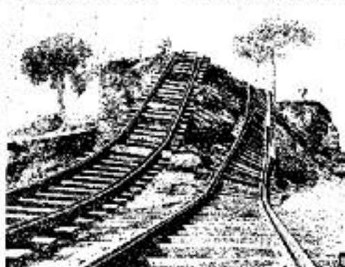
Reportatge gràfic que mostra alguns dels danys causats per les fortes riuades, publicat a La Vanguardia el 28 de setembre de 1962.