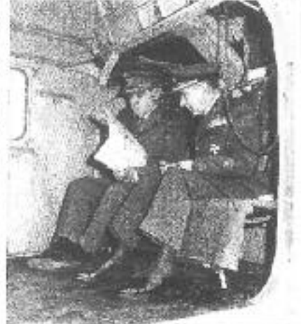
Unos de los heridos en el ataque a la casa de la calle de la...