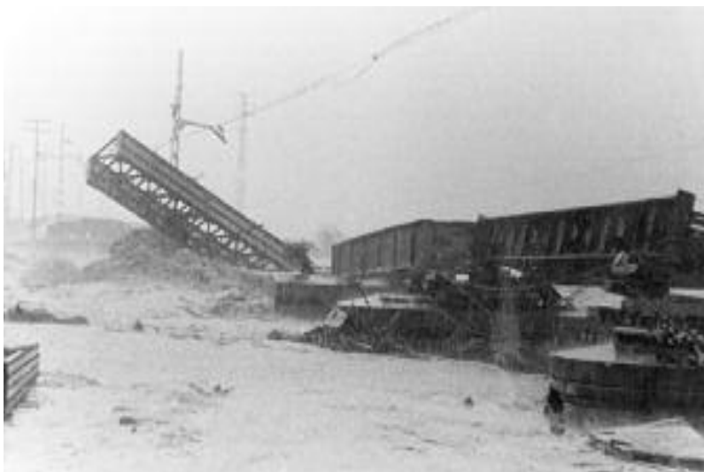
Moment en què el riu Ripoll trenca i arrossega el pont de ferro de la línia de ferrocarril de França a Montcada i Reixac.