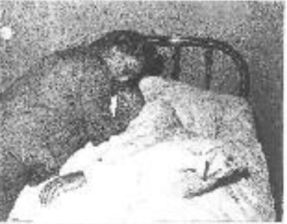
Unos de los heridos en el ataque a la casa de la calle de la...