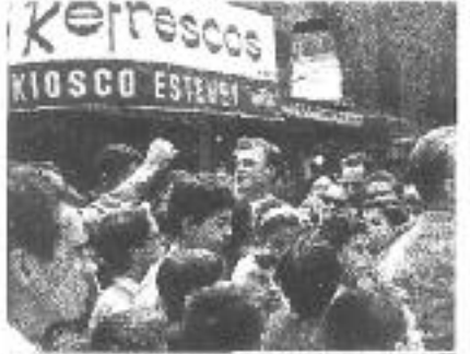
Unos de los heridos en el ataque a la casa de la calle de la...

Primera pàgina de La Vanguardia del 29 de setembre de 1962, amb referències explícites a l'actuació de les autoritats franquistes.