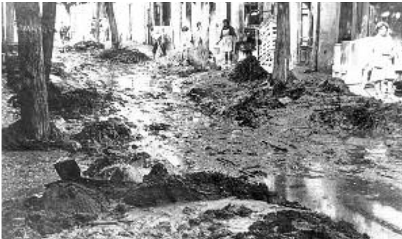
El carrer Major de Montcada i Reixac ple de fang, l'endemà dels aiguats de 1962.

El total de danys materials es va xifrar en 2.650 milions de pessetes i corresponia principalment a infraestructures (ponts, trams de carretera i ferrocarril) i a indústries tèxtils, moltes de les quals s'ubicaven a prop de les lleres dels rius.