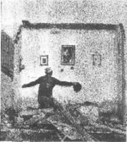
Unos de los heridos en el ataque a la casa de la calle de la...

"GRAVEDAD EN EL DOLOR Y FORTALEZA CONTRA LA ADVERSIDAD..."