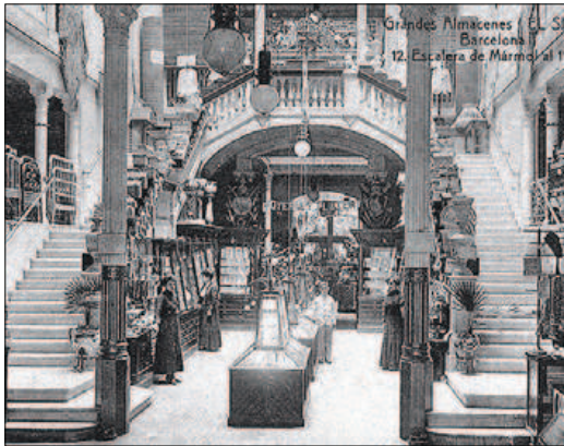
Grandes Almacenes El Siglo Barcelona 12. Escalera de Mármol al 11