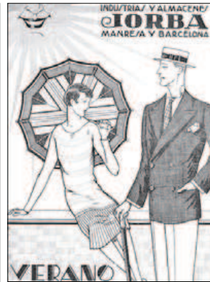
INVENTS DEL CARRER ▶ Els grans magatzems El Siglo, els primers tramvies i metros, bústies, aparcaments subterranis i la publicitat a la premsa i en pirulins al carrer que van sorprendre els barcelonins.