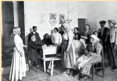
Catalunya en negre

Aquest mes volem recomanar dos llibres que acaben de sortir del forn de la mà d'Albertí Editors. El primer és el llibre CATALUNYA EN NEGRE, una obra de Mercè Balada (Barcelona, 1965). En ell hi trobareu una quarantena d'assassinats i cinc execucions, a més d'un nombre encara més elevat d'intents d'homicidi i llargues penes de pressó. És el cruent resultat de cent cinquanta anys de crims i criminals, explicats a través de setze casos esfereïdors produïts a Catalunya entre 1838 i 1976. Una crònica negra que ens farà revivre fets horripilants. El segon és el llibre BARCELONA, CIÈNCIA I CONEIXEMENT, una obra de Miquel Carandell (Barcelona, 1981). Es tracta d'un recull dels fets científics més rellevants esdevinguts a la