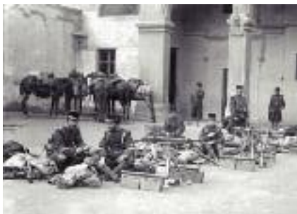
Secció de metralladores al pati del mercat de Sant Antoni, durant la vaga de dones del mes de gener de 1918.