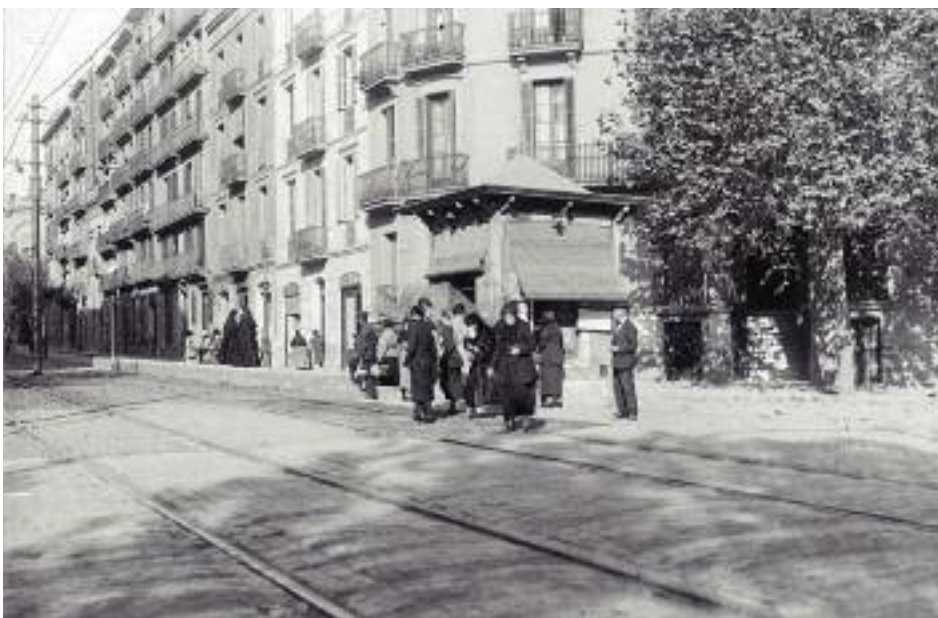
L'antiga estació de Provença del Ferrocarril de Sarrià, al carrer de Balmes. Com es pot observar, la gent havia de travessar les vies sense cap mena d'element de seguretat.