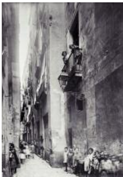
La pobresa s'havia estès pels barris ja deprimits, on les condicions de vida eren pèssimes, com al Raval, on les famílies obreres no disposaven de mitjans ni per posar el plat a taula. A la fotografia, el carrer dels Flassaders.

El dia 12, moltes dones van abandonar les fàbriques on treballaven i es van llançar al carrer, amb un primer esclat de fúria adreçat contra cafès cantant i altres establiments de disbauxa, sovintejats per especuladors, nous rics, personatges misteriosos i professionals del sexe. Malgrat els acudits, no es tractava de sufragistes com les angleses, dones de l'alta societat liderades per