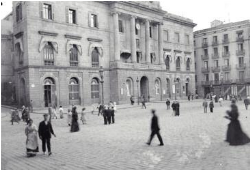
L'Ajuntament de Barcelona el 1918, el primer any sencer amb alcalde elegit democràticament.

Morales era un personatge curiós, antic cantant d'òpera i tractant de vins, nebot d'Hermenegildo Giner de los Ríos, que se situava en un indefinit