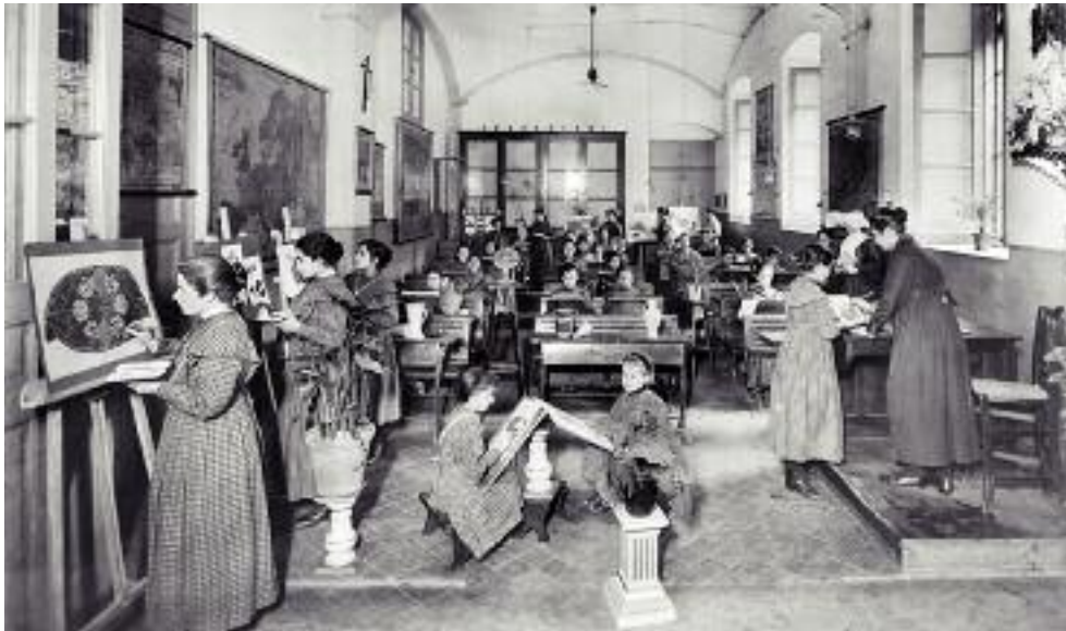
Nenes de la Casa de la Caritat de Barcelona durant una classe de dibuix. El 1918, les noies ja podien rebre formació artística, tot i que la temàtica estava limitada a les flors. /ANC. AUTOR: BRANGULÍ/

Emmeline Pankhurst que exigien el dret de vot, sinó obreres dels barris empobrits del Raval, l'ignominiós Districte Cinquè, de carrers com l'Arc del Teatre, Tàpies o Riereta, armades amb pancartes on es podia llegir Abajo las subsistencias i Mujeres, todas á la calle a defenderse del hambre. Fuera los acaparadores. Poned remedio al mal, por humanidad. A la calle todas .