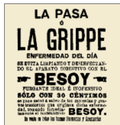
LA VANGUARDIA, 8/6/1918