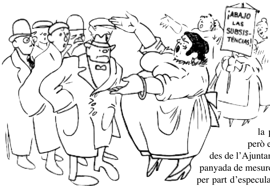
Miss Pankurst del Districte V , acudit publicat el 18 de gener de 1918 a L'Esquella de la Torratxa : — Vosaltres a casa!... A rentar els plats i a cuidar la mainada!

accions policials, detencions, càrregues i corredisses que s'estengueren a tota la ciutat vella, especialment a la Rambla i els carrers que conduïen al Govern Civil, però també a l'Eixample i tots els barris obrers perifèrics. La revolta de les dones ja era general.