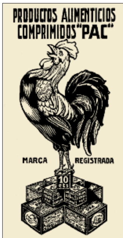
LA VANGUARDIA, 15/5/1918