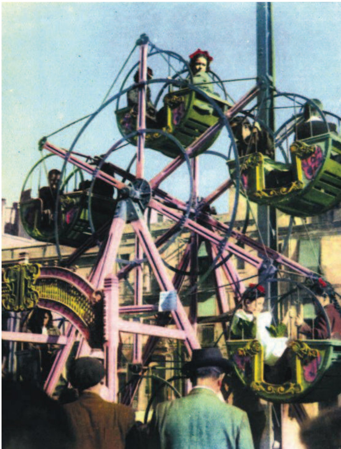
La nòria ha estat un element obligatori de tots els parcs barcelonins. A la foto, un d'aquests engins als anys cinquanta.