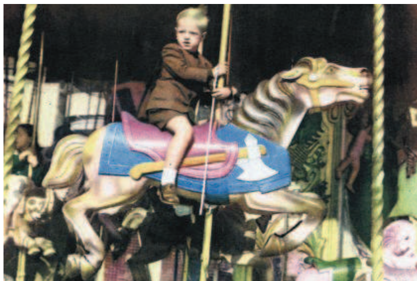
Estampes dels parcs d'atraccions de Barcelona. A dalt a l'esquerra, les cadires voladores del Tibidabo. A sota, dues instantànies familiars del parc de Montjuïc als anys seixanta. A dalt, en blanc i negre, muntanya russa de les atraccions del Gran Casino de l'Arrabassada (del llibre sobre el sumptuós complex publicat per Viena Edicions). A sota, un nen galopa sense tenir-les totes als cavallets del Caspolino, als anys cinquanta.

Salvador Puig Antich es va deixar la pistola a les atraccions Caspolino