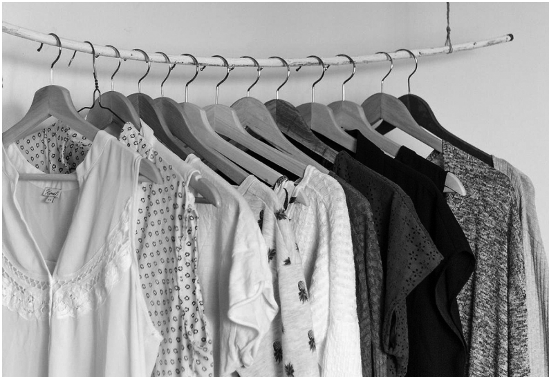
Peces de roba noves de trinca, llestes per ser estrenades per alguna clienta.

En tractar-se d'un objecte del tot fet a mà, és comprensible que no tingués una forma perfectament esfèrica i, per tant, calia trinca la pilota de nou en nou, és a dir, fer-la botar algunes vegades contra terra o contra la paret del trinquet per tal que s'arrodonís.