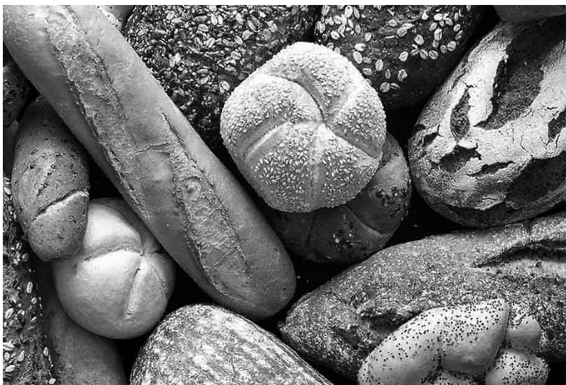
Pans de diferents formats tal com figura que els catalans fem amb les pedres.

A mesura que anava avançant la guerra, es van incendiar diverses poblacions, com ara Poblet, Calaceit, Xàtiva, Lleida, Terrassa, Manresa, Sitges... També es va imposar l'anomenat