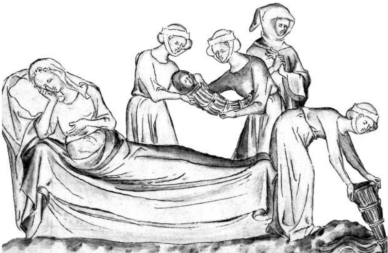
Naixement aristocràtic a l'edat mitjana, amb l'assistència de quatre serventes.