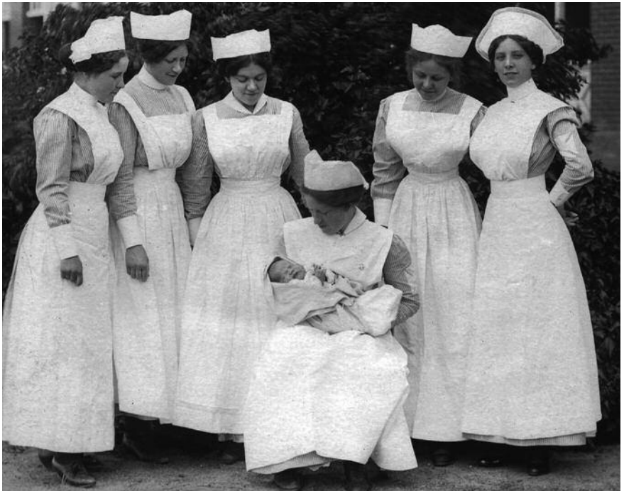
Fotografia d'autor desconegut d'una promoció de llevadores, a principi del segle XX.

A partir de 1926, per obtenir el títol de llevadora ja era obligatori disposar del títol de batxillerat elemental, el 1928