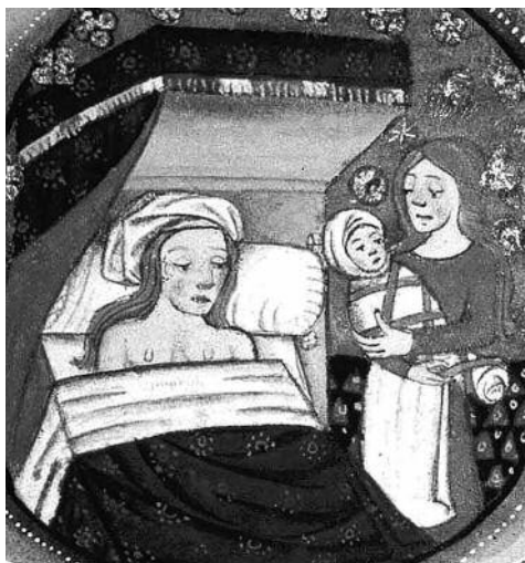
El naixement en una miniatura de l'edat mitjana, amb els tres protagonistes: el nadó, la mare i la llevadora.

Eren dones, normalment vídues, amb experiència, que preparaven la parte-