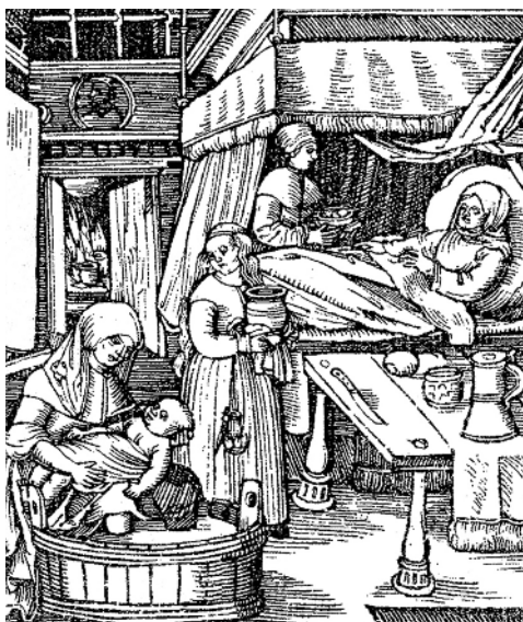
Una mare i el seu nadó amb les llevadores, en un gravat de 1524.

Ésser ver que la dita fadrina es estada assajada de corrompre i li havien fet son poder, mas que no la havien poguda violar, com la dita fadrina hagués haguda una malaltia en lo engonal, que la pell