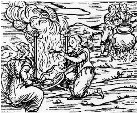
Sortilegis amb nadons, en un gravat inclòs al llibre Compendium maleficarum , escrit el 1608 per Francesco Maria Guazzo.

Estava acusada de pràctiques rituals vinculades al part, la cura del nadó i la fertilitat. És a dir, de bruixeria. Interrogada per la cort episcopal, la Sança respongué que ella només ajudava les mares en el moment de parir, llevant els infants . A més, diagnosticava, guaria i prevenia algunes malalties dels nounats .