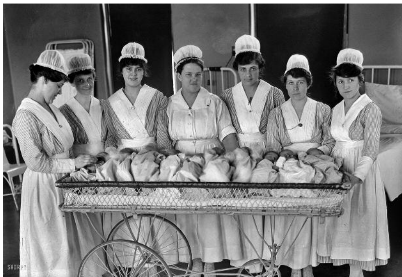
Llevadores i nadons en un hospital, cap a la dècada de 1910.

s'establí el pla d'estudis per cursar l'especialitat en escoles de matrones i el 1929 es van publicar les ponències del Primer Congreso Nacional de Matronas, celebrat a Madrid, i les del Primer Congrès Internacional de Matrones de Barcelona.