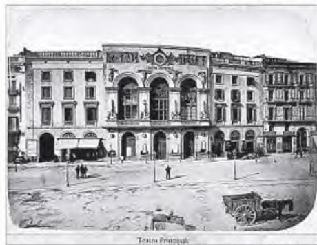
Una imatge del Teatre Principal l'any 1874

país de l'hospital, però des del 1597 es van traslladar a un terreny en el que havia de ser un eix principal de la ciutat encara que llavors era poc més que un torrent, la Rambla. Des del 1597 es farien funcions en un cobert i el 1603 s'inauguraria un edifici amb seriosos problemes que donaria pas a un altre el 1618. Després de la guerra de Successió els militars van passar a controlar la vida teatral. I el marquès de Mina, capità general, que havia viscut a Itàlia, on es va aficionar a l'òpera, va introduir el gènere a la ciutat. L'òpera competia amb el teatre en castellà i el circ i va acabar imposant-se. Però el 1787 un gran incendi va destruir el teatre. Va ser reconstruït, ampliat i inaugurat amb l'òpera La caccia di Enrico IV ,